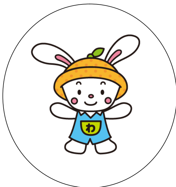
静岡県幼児教育推進マスコットキャラクター 『わっ!ぴょん』