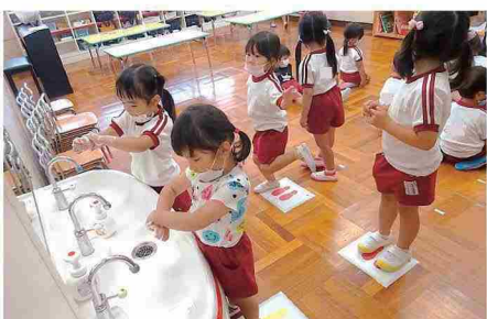
感染予防対策の意識が身に付いてきた

保護者には、新型コロナウイルス対策についての園の対応や子供の様子などを伝えるために、園だよりを以