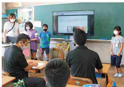
商品開発で企業に提案する子供たち