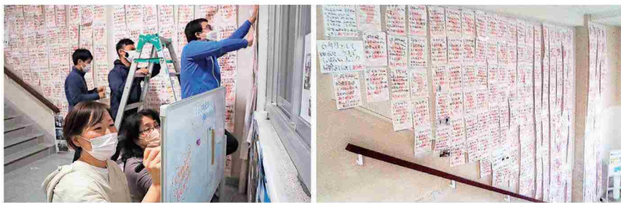
一面に掲示された「ありがとうメッセージ」の足跡

そこで、毎日子供の名前と表れを書いた「ありがとうメッセージ」を学年掲示板に貼りました。