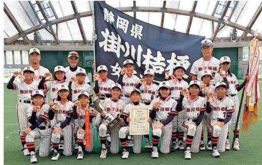
全国大会春夏連覇を果たした掛川桔梗女子ソフト