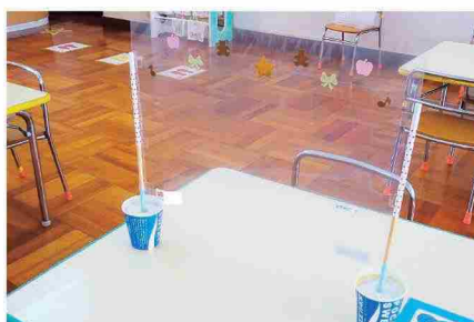
夢中になって遊ぶ子

職員間で話し合い「コロナ禍だからできない」ではなく「コロナ禍でもできること」に視点を変える