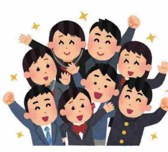
◀「Futureしずおか」ガイドブックの贈呈 【教育政策課】TEL 054-221-3674