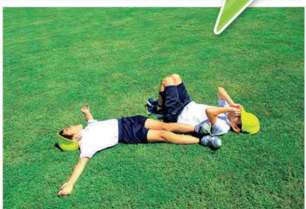
芝生グラウンドでの様子(県立伊豆の国特別支援学校、令和3年9月)▲

天然芝のグラウンドには、屋外活動時間の増加、ケガの予防、砂じん対策、ストレス軽減など、多くのメリットがあります。