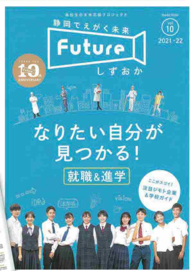
◀◀「Futureしずおか」ガイドブック

「Futureしずおか」は、高校生に地域企業で働く、地域で暮らす魅力を発信するプロジェクトで、2012年から実施しており、今年で10周年を迎えました。企業の業務内容や、活躍する若手社員のメッセージ、静岡県の誇れるデータ、進学・就職活動へのアドバイス、面接の留意点など盛りだくさん! 県内の各高校を通じて、2年生全員に配られます。