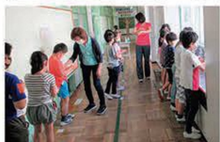
手洗い指導をしている様子

生活様式」を作成しました。そこで、保健主事を中心に、一日の子供の活動に対応した西小版「新しい生活様式」を作成しました。正しい手洗いの仕方、先生方に覚えてもらうために、保健主事と一緒に