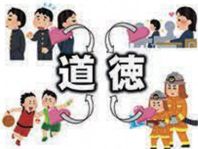
教育活動全体の要としての道徳

生徒の心の成長のチャンスは授業、学校行事、部活動、そして休み時間まで。学校生活のあらゆる場面にあります。思春期の中学生はさまざまな葛藤やモラルジレンマと向き合いながら生きています。