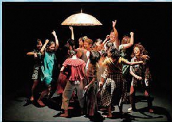
2019年の小作品発表の様子

オーディションで選ばれた静岡の中高校生が、芸術表現として世界に通用するメッセージを持ったダンス作品を創作する「スパカンファン・プロジェクト」。フランスを拠点に活躍する振付家・ダンサーのメルラン・ニヤカム氏を迎え、2010年の発足からこれまでに「タカセの夢」「ANGELS」の2作品を創作、国内外で公演を行いました。