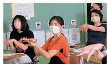
正しい手洗いの仕方について動画を見ながら全職員が学んでいる様子

新型コロナウイルスによる突然の休業。しかし、休業に入るまでの時間と、新型コロナウイルスに関する情報量が少ない中、養護教諭として何をして子供たちに伝えるべきかを考えました。保健だよりを作成し、新型コロナウイルスとはどのような病気なのか、どのようなことに気を付けるような生活を送ればよいのかを伝えました。