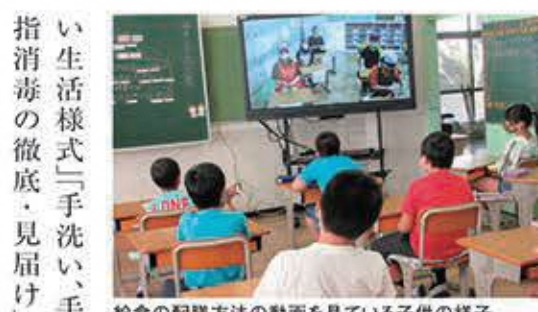
給食の配膳方法の動画を見ている子供の様子