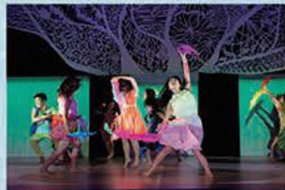
「ANGELS」～空は翼によって測られる(2018年東京芸術祭)

オーディションで選ばれた静岡の中高校生が、芸術表現として世界に通用するメッセージを持ったダンス作品を創作する「スパカンファン・プロジェクト」。フランスを拠点に活躍する振付家・ダンサーのメルラン・ニヤカム氏を迎え、2010年の発足からこれまでに「タカセの夢」「ANGELS」の2作品を創作、国内外で公演を行いました。