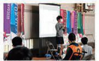
▲「障害者スポーツ応援隊派遣事業」にて講演するパラ陸上選手(静岡県立中央特別支援学校)

県は、障害者スポーツの普及・振興を図るために、「わかふじスポーツ大会」のほか、パラリンピック出場選手が講演や実技指導を行う「障害者スポーツ応援隊派遣事業」や、パラサイクリングの推進に取り組んでいます。