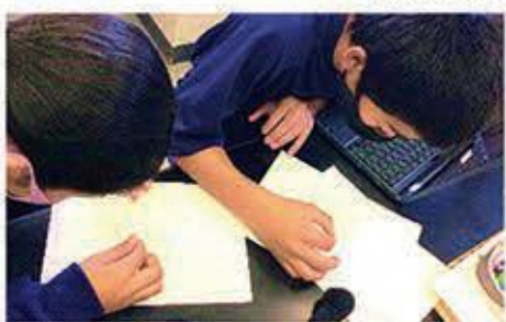
スケトウダラの卵を数える生徒

1年生の理科では動物の産卵について学習します。魚類の産卵数の多さに問いをもった生徒が、タラコの数を調べる学習を行いました。スケトウダラが産む数十万個の卵のうち、大人まで成長できるのはたったの数匹であることは、生徒にとって大きな驚きであり、自然界の厳しさや生命の大切さについて考えるきっかけになりました。