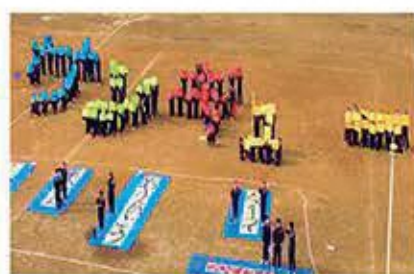
コロナでも諦めない！ コロナ禍に生まれた新たな伝統