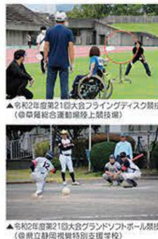
▲令和2年度第21回大会フライングディスク競技(草薙総合運動場陸上競技場)