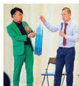
感謝の千羽鶴贈呈

か。全ての教育活動には道徳教育の側面があります。今後もそれらを意図的、計画的に実践していくことで、心の成長をサポートしていきたいです。