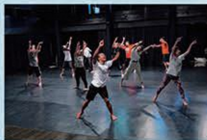
2019年の創作ワークショップの様子

ワーク・イン・プログレス発表会 8月21日(土)・22日(日) ◆ 舞台芸術公園 屋内ホール「精円堂」 チケットほか詳細はSPACチケットセンターまで(TEL.054-202-3399)。