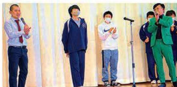
ぬまんづの講演会:生徒と筆者(写真中央)

した。職業人が語る人生観には説得力があり、夢をもつこと、個性をのばすことの大切さに気付くことができました。