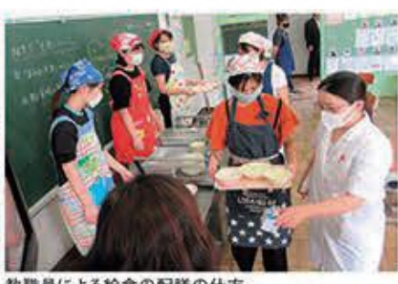
教職員による給食の配膳の仕方

「生活様式」「手洗い、手指消毒の徹底・見届け」「児童の健康状態の把握」「給食の配膳・下膳の仕方」「校内の消毒」など。そこで、保健主事を中心に、一日の子供の活動に対応した西小版「新しい生活様式」を作成しました。正しい手洗いの仕方、先生方に覚えてもらうために、保健主事と一緒に