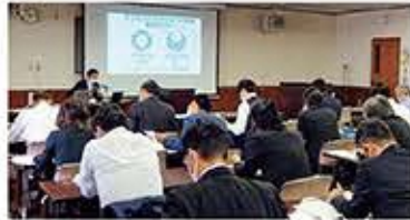
▲各推進校担当者による県内セミナーの様子