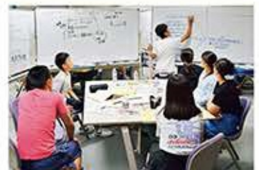
▲ディスカッションの様子(令和元年度) テーマ「みんな知事になって理想のまちをつくらう」