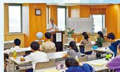
▲講義の様子(令和元年度)

静岡県では、中学1・2年生を対象に、学校や日常生活とは異なる学びの場を提供する「未来を切り拓くDream授業」を行います。3泊4日で行う世界で活躍する一流の講師による講義やグループディスカッション等を通じて、子供たちの大きな飛躍が期待できます。