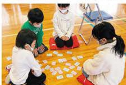
葉梨地区伝統の百人一首