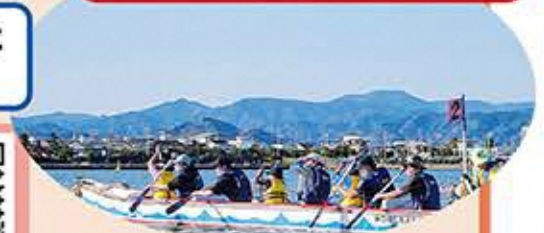
▲昨年のキャンプの様子

☆その他、県では「ネット依存対策講演会」や「ゲーム障害・ネット依存対策回復支援プログラム」等も企画しています。詳しくは静岡県のHPを御覧ください。