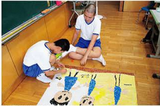
朝の自立活動に取り組むAさん

Aさんとの授業を紹介します。Aさんの時間の指導は人との関わりに着目しました。Aさんが好きな貼り絵を友達と一緒に制作するように設定しました。