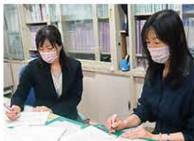
事務室での打合せ 筆者(左)

最後に 共同学校事務室の設置により、学校現場の業務改善や教員支援は少しずつ、着実に進んでいます。今後共同学校事務室と勤務校の両方から教員を支援し、子供たちの健やかな学びにつなげていきたいです。