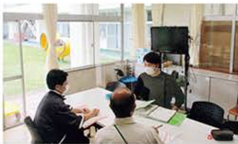
課長間で話し合いをする筆者

研究指定を経て、本校は自立活動を立ち上げ、自立活動を推進しています。自立活動の運営について家を例えて考えてみます。子供たちの目標を屋根とするならば、その屋根を支える大黒柱は、