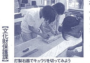
打製石器でキュウリを切ってみよう

8月1日(水) 「埋蔵文化財活用術」 頭と身体を使って 学んでみよう! 火起こしや土器バズルなど児童生徒向けの古代体験メニューを体験。また、それらを授業で活用する方法を学び、出土文化財展も見学します。その後、静岡市内の調査現場で発掘体験を行います。体験中に、歴史的な大発見があるかも!!