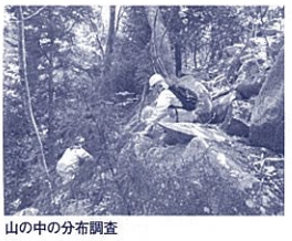
山の中の分布調査

間、静岡県教育委員会から岩手県教育委員会に派遣され、大震災からの復興に伴う埋蔵文化財(遺跡)の業務を担当しています。