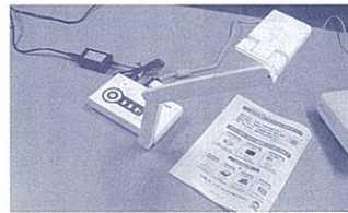
持ち運び便利な小型実物投影機

「分かる授業」の実現に向けて、簡単に効果的なICT活用の一つの方法は、実物投影機・ヒデオカメラなどデジタルテレビ、プロジェクター・電子黒板などを接続して、教材や手順等を大きく映すことです。