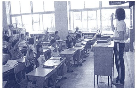
フラッシュカードを用いた授業

私は、学級の中に、友達を傷つける子や自分の気持ちを表現できない子がいて困っていました。そんな時、初任者研修で「発達支援教育」についての講義を受けました。浜松市教育委員会が人づくりについて示した「はままつりの教育」では、「一人一人の違いが大切にされ、互いを認め合い、学び合う経験が豊かである集団」の大切さが述べられていました。そこで私は、発達支援教育の理念を基に、互いを認め合う学級づくりをしたいと考えました。