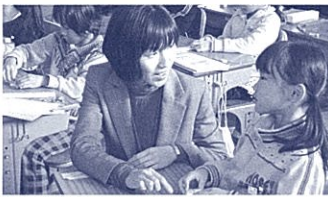
聞き手のそばでしゃがみ、個別支援