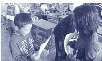
グループエンカウンターで交流