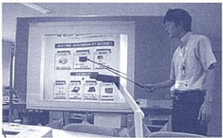
実物投影機で教材を投影した活用例

ICT活用例として、小学校家庭科の「衣服の手入れ」の場面があります。ボタン付けをさせる際、言葉だけの説明や教卓に集めて手本を示す方法では限界があります。そこで、実物投影機とプロジェクターを使い、手元の作業を大きく映すことにより、「玉結び」「ボタン付け」「玉止め」のやり方を分かりやすく説明することができます。