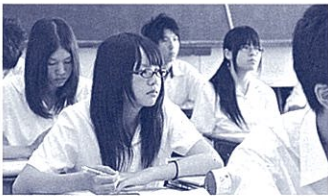
意欲的に取り組む

【基盤①】まず、学校生活の中では、教員として、誰に対しても、どんな時でも「聞くこと・見ること・話すこと」に丁寧に取り組むことです。