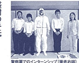
警察署でのインターンシップ(筆者右端)

感謝の手紙 伊東高校の生徒から手渡された2通の手紙がありました。卒業式の前、感謝の気持ちを伝えたいと思う人へ書いた「感謝の手紙」です。その宛先に私を選んでくれたことに、驚きとうれしさを感じたことを覚えていきます。