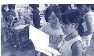
相互交流で考えを伝え合う