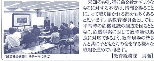
「被災社会を築く」をテーマに学ぶ

それでは、教育現場は安全を確保するために、何をすべきなのでしょう。各学校の置かれている状況が一律ではない中では、それぞれが考えて対策を取るしかない。それには、「まずは、地域の災害環境を良く知る」こと。具体的には、 地震など災害の瞬間に学校で何が起きるのか、冷静に分析し情報を共有すること その時何をすべきか、そのために何を備えるべきか 時間帯や天候など、環境は一定ではない 臨機応変といながらも、一定のルールと準備が必要 そして行動して検証することが大切