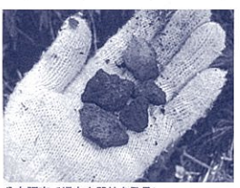
分布調査で縄文土器片を発見!

平成23年3月11日に起きた東日本大震災と大津波では、多くの人命、財産が失われました。しかし、商売や祭りを再開させ、地域の復興を目指す被災地の姿をテレビなどでも多く目にします。