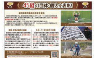
Eジャーナル255号に掲載 (R5.1.5発行)

を司会の進行に含めることで表彰式の意義を参加者に感じてもらうように働きかけたり、受付に設置したモニターに受賞者の功績をまとめたスライドショーを流すことで、より多くの人に受賞者の功績について知ってもらえる機会を設ける工夫をしました。また、当日の進行がスムーズなものとなるよう、事前に関係者との調整や会場の確認を入念に行いました。