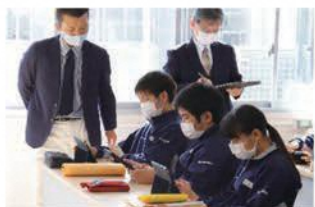
令和2年に実施した校内提案授業

授業の主役は生徒だと感じました。ICTを活用するかしないかではなく、生徒が主体的に学習に取り組み、付けたい力をつけるために、ICTを活用することのメリットを考え、効果的な学習道具となるような取組を考えました。