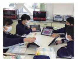
家庭科の授業風景