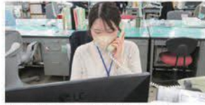
教育総務課 執務室内の様子

教育総務課総務班の業務は文書の收受発送や、表彰に関すること、教育に関する法人の指導監督、部内の連絡調整、公文書開示請求など、多岐にわたります。