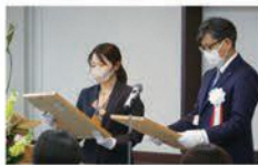
表彰式当日の様子

私は、今年度この表彰式の業務を担うことになり、「表彰式を開催することにどのような意味があるのか」「表彰することで児童・生徒に何を感じてほしいのか」を考え、児童・生徒の更なる活躍の励みとなるような式を目指し、準備・運営に取り組みました。具体的には、表彰項目の説明など