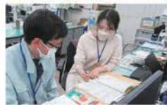
表彰式の打合せの様子

毎年、教育委員会では、教育、学術等で教育の振興に貢献した方や、全国規模の競技会等で最高位の賞を受賞した児童・生徒に対し、その功績を称えるために「教育委員会表彰」を行っています。