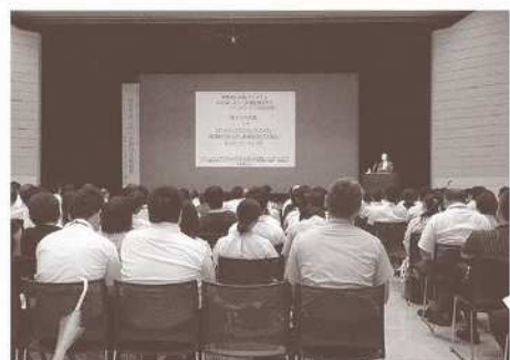
高校との合同講演会

どこに相談したらよいか悩んでいたB高校のケースでは、医療や福祉行政とつなぐことで支援の広がりや深まりが生まれました。実践が深まっている高校のコーディネーターが他の高校で研修講師を務める、先進的に特別支援教育を推進している県外の高校へのつなぎを求める(本校主催の講演会がきっかけ)