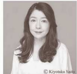
ピアニスト 仲道 郁代 「ベートーヴェンと歩む人生」