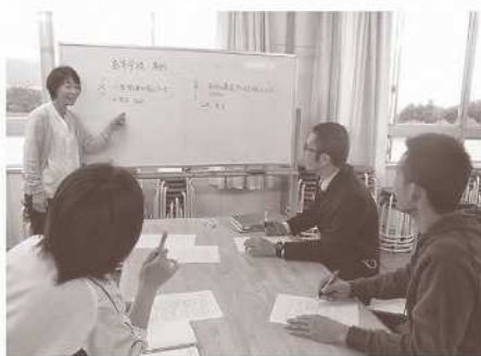
高校の現状について情報交換(筆者)

相談の第一歩は実態把握、情報収集です。相談のあったケースについては授業参観をさせていただけました。該当生徒に関わる教員と共にケース会議に参加し、情報を共有しました。そこは、校内の教職員をつなぐ場にもなっています。参加した教職員からは「こ