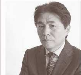
NHKサッカー解説者 山本 昌邦 「子育てこそが未来を生み出す」