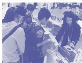
大人顔負けの接客を見せてくれました。

お店ではこども店長として、(同年代の)社員に仕事内容を教えることがあります。人に説明するのは責任も感じますが、楽しいです。これからもいろんなことにチャレンジしていきたいです。