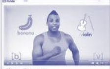
〈You Tube MEXTチャンネルより〉