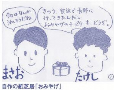
自作の紙芝居「おみやげ」

平成23年10月、衝撃的なニュースが報道されました。大津市で起きたはじめ自殺事件。当時、教育学部に通う学生だった私にとって、多くのことを考えさせられた。紙芝居には、登場人物の表情に注目して考えられるという良さがあります。この授業では、「思いやりに大切にしたいことを伝える」という2つの意見を基に議論を交わしました。相手が関係の浅いけんたくんだったらどう？と相手の立場を