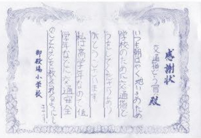
子どもたちが書いた交通指導官への感謝状

昨年4月、5年生を対象に道徳についてのアンケートを行いました。子どもたちの回答からは、もともと共々に考え、実践していきたいと思っています。