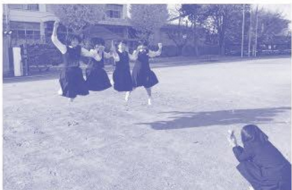
ポスターに使う写真を撮影する生徒たち

美術科では、見栄えの良い作品の完成を目的とするのではなく、生徒がその題材を通して何ができるようになるのかを考えることが重要です。デザインの学習では、生徒が目的や機能を意識し、思考力・判断力を働かせながら試行錯誤を経て、形にしていく表現の過程に学びがあると考えています。そのような考えを