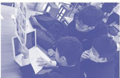
チームで話し合いながらポスターを作成

作品の構想に入る前に、静岡大学でデザインを学ぶ学生を招き、ポスター制作における試行錯誤について、話をしてもらった機会を設定しました。作り手と直接関わり、対話をする中で1枚のポ