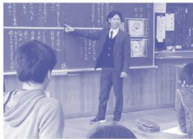
生命尊重の授業を行う筆者