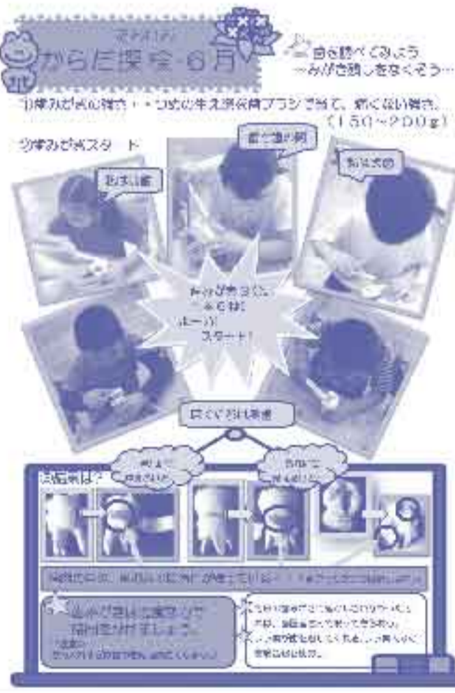
「からだ探検」の教材

学習の様子は保健だよりと掲示物で保護者に知りませました。家庭で話題にしたり、手洗いや歯みがきを親子で実践したりするなどうれしい報告もありました。