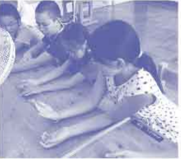
生理食塩水を付けて風を当てることで汗の作用を確認

体温を調べてみよう、平熱を測って、1分間かけ足、スタート、子どもたちからは、「息が