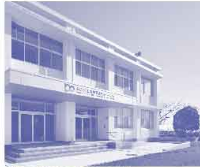
校舎の雰囲気を残した外観

旧県立静岡南高校の校舎を改装し、当時の机やイスを活用したスタイリッシュな展示が評価され、日本空間デザイン賞(日