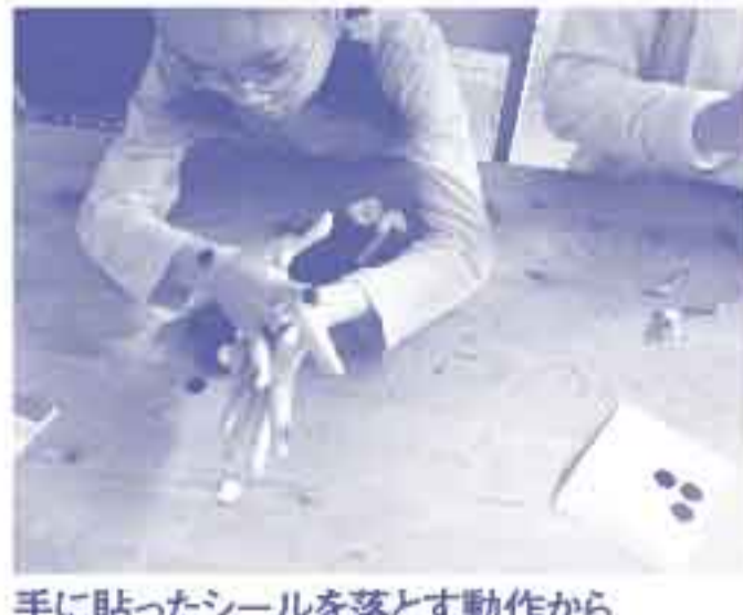
手に貼ったシールを落とす動作から手洗い方法を身に付ける

体温測定や、歯みがきなど一見簡単な作業も、正しく伝えるためにはしっかりとイメージできるようにすることが大切です。体温測定では人形を使って、体温計の持ち方、脇の下に入れる方向、角度などを考えてから、自分の体温を測りました。