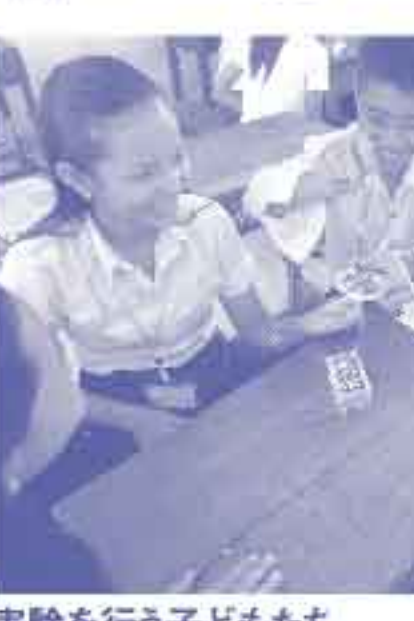
実験を行う子どもたち

「自分の力を試してみたい」「カンボジアの教育の思いから、平成26年度からの2年間、青年海外協力隊に参加しました。首都プノンペンからバスで7時間のバタンバン州で、中学校に理科の実験を紹介する活動を行いました。現地は、理科室はありますか、実験器具すら一つもない学校ばかりでした。簡単な思いを抱き、活動を始めました。