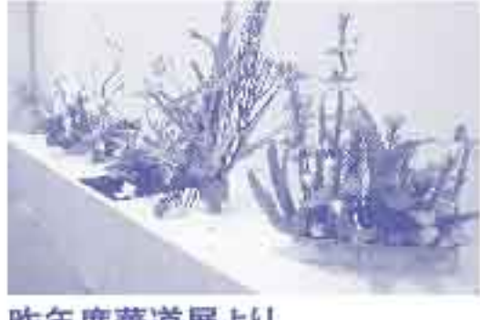
昨年度華道展より