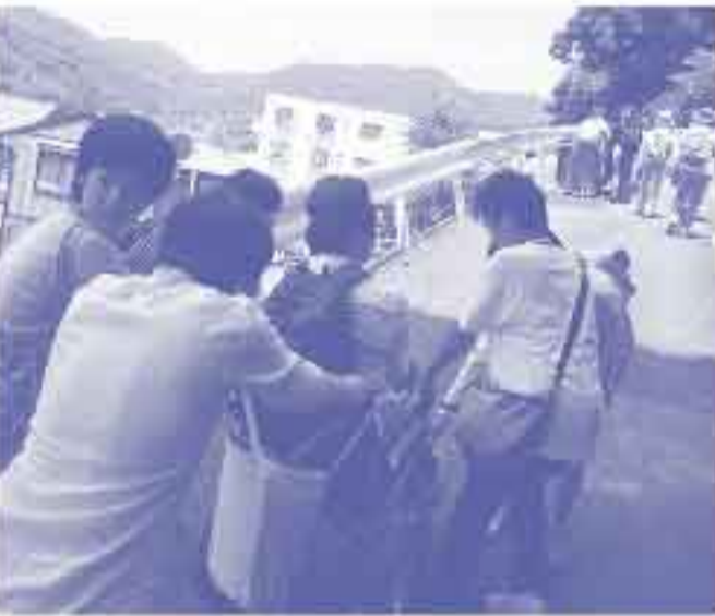
ツアーのボランティアに参加する生徒