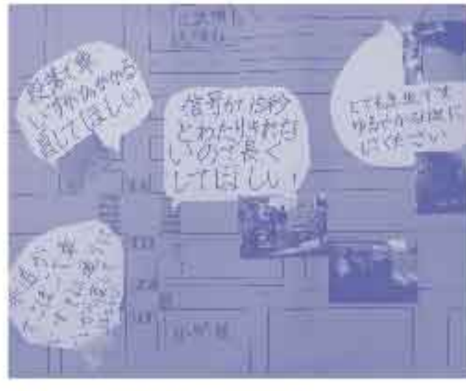
住みにくさを地図にまとめる

会や交流会などに1年時から継続して参加しています。また「青いかば旅行社」主催のツアーにボランティアとして参加するなど、3年生になった今年度も、学年全体の3分の1の生徒が積極的に福祉活動に参加しています。