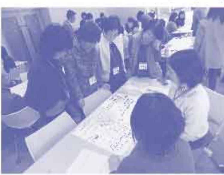
家庭教育支援員養成研修会より

家庭による江戸開府から、ベリーの黒船艦隊の江戸湾来航までの250年を通して、「徳川の平和」の現実と理想が、絵画作品の中にどのように映し出されているかをじっくりと読みとっていただきたいという願いを込めて、このたび、県立美術館では江戸絵画の名品、傑作を紹介し、徳川時代を通過する日本最大規模の江