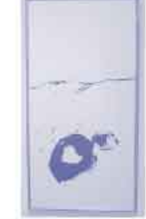
昨年度書道展より