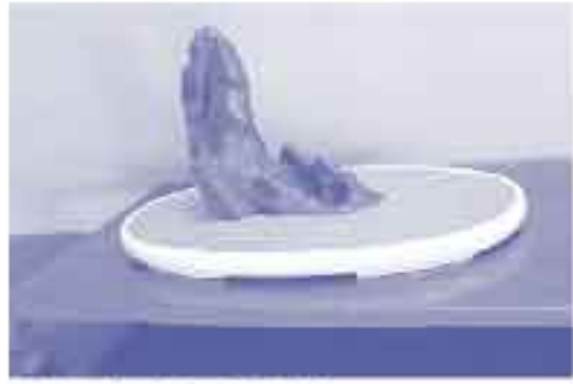
昨年度水石展より