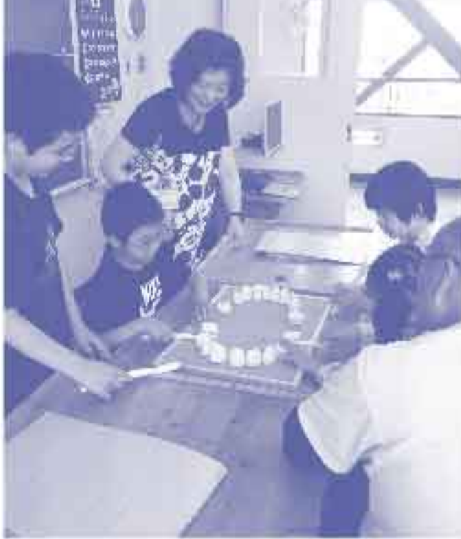
歯みがきの指導をする筆者

私は子どもたちに、自分のからだに興味を持ち、健康に過ごすための正しいスキルを身に付けてもらうと、月に1回15分間の保健指導「からだ探検」を実施しました。