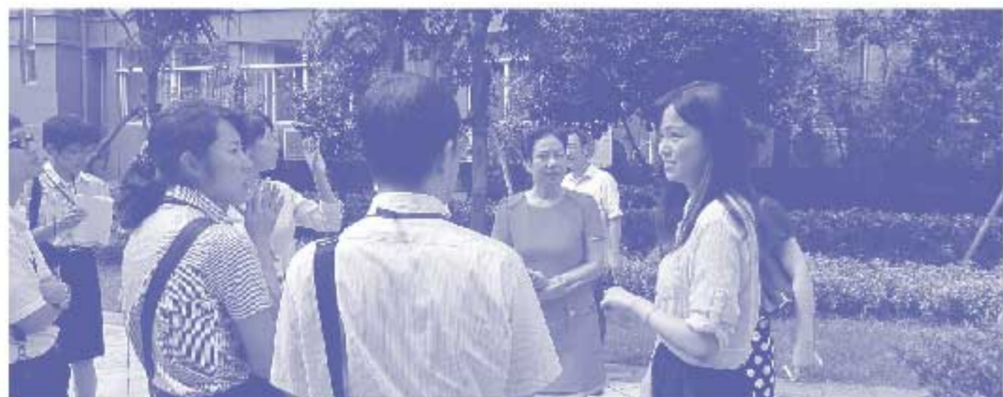
浙江省交流で中学校を視察。教育について活発な意見交換が行われました。

◆費用 15万円(上限7 ◆定員 30人 ◆開催日 7月、12月の土曜日 ◆対象 中国事情や中国語を学ぶ講座等を行います。 ◆対象 中国との交流に関心のある、県内の20代から40代までの方 ※本交流参加教員は、10年経験者研修の「社会体験研修」を実施したものと取り扱われます。