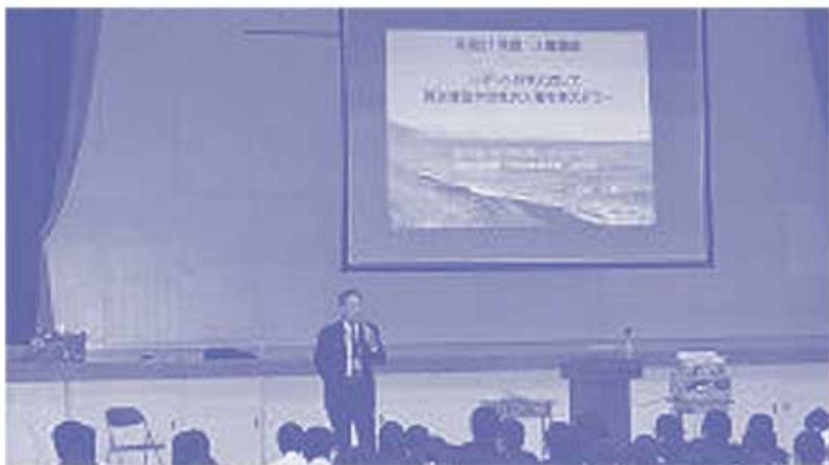
県立島田高等学校での人権研修

問 静岡県人権啓発センター (静岡県健康福祉部地域福祉課人権同和対策室) 〒420-0856 静岡市葵区駿府町1-70 静岡県総合社会福祉会館4階 ☎054(221)3330・2303 ☎054(221)1948 Eメール jinken@pref.shizuoka.lg.jp HP http://jinken.pref.shizuoka.jp/