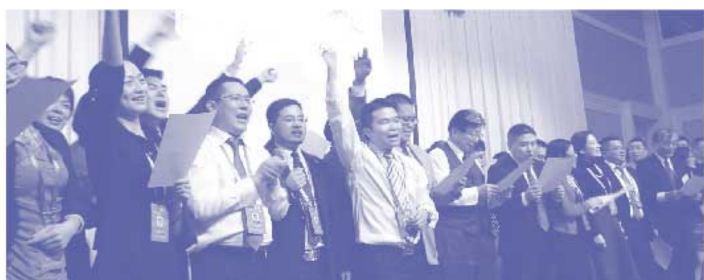
静岡県交流歓迎レセプションにて。国籍・業種を越えた絆が生まれました。