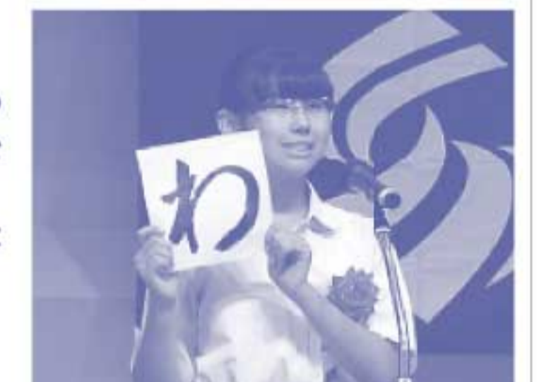
発表時は、服装、小道具などパフォーマンスの取り入れも可能です