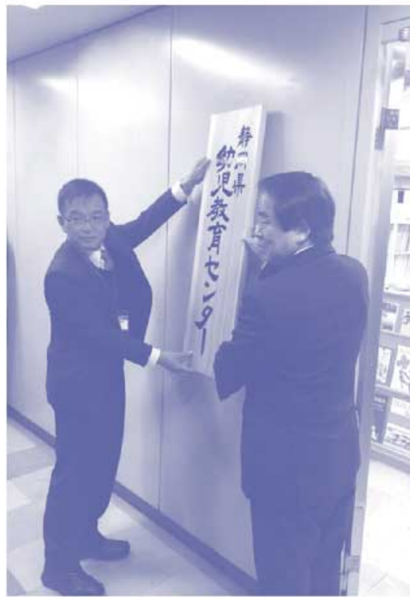
開所記念セレモニーより

すべては子どもたちの笑顔のために 平成28年4月、静岡県幼児教育センターが県庁西館7階に開設されました。センターでは、幼児教育