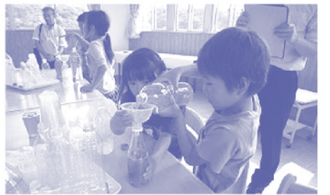
どんな色になるかな?

この活動で、私が大切にしていることは、教師の恣意的な活動にならないようにすることです。子どもが並べたくなる形の組み合わせを意図しておいたり、光が美しく差し込む活動場所を設定したり、「思わずそうしたくなる」という仕掛けを考えるのです。