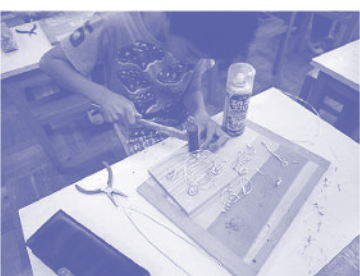
「静岡スペーススター」制作中

この活動で、私が大切にしていることは、教師の恣意的な活動にならないようにすることです。子どもが並べたくなる形の組み合わせを意図しておいたり、光が美しく差し込む活動場所を設定したり、「思わずそうしたくなる」という仕掛けを考えるのです。