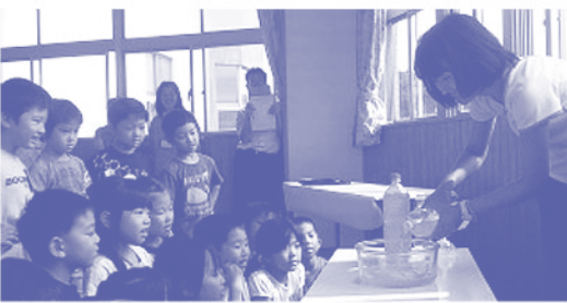
色水の変化を見つめる子どもたち

私は、「造形遊び」とは、絵や立体、工作を行うためのウォーミングアップであり、絶えず試行錯誤を繰り返しながら、素材や道具、そして設定された場の可能性を発見していく活動だと考えています。