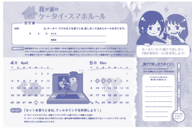
2016年度版カレンダーより(※静岡産業大学情報学部の学生がデザインを担当)

録料98、6年生と新中学3年生の000円の全家庭に配布しました。このカレンダーは、親子で話し合っただけで決めたルールを守って、誤作動による取り消しを減らす。SNSなどインターネット上でのトラブルは、保護者や先生が気付く前に、深刻な状況に発展してしまいうるケースもあります。カレンダーには専門の相談機関も掲載されていますので、県教育委員会HPからダウンロードして教室に掲示しておくこともおすすめです。