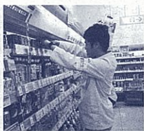
商品の梱出し作業(職場実習より)