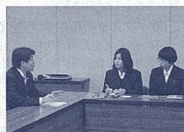
生徒による取材風景

伊豆の名物である金目鯛ひじきわさび等を用いた健康志向のお弁当を提案してくれました。伊豆の名産であるわさびをお弁当の定番である玉子焼きに練り込むアイデアはとももユニークで、試食もしましたが、とても美味しかったです。