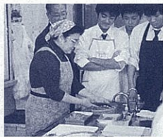
漁港おかみさんによる「鰯のさん」作り指導