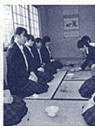
3年生全員が学ぶ「茶文化探求」(小笠高校)

◆総合学科の魅力とは 総合学科高校の特色は、中学校の段階で将来の進路や職業が決まらなくても、高校入学後に様々な道を選択できることです。総合学科では、高校入学後の1年次に「産業社会と人間」という科目で体験的な学習や進路ガイ