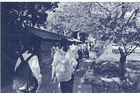
フィールドワークの様子

「至誠・雄飛・献身」です。生徒たちは、下田高校で青春時代の3年間を過ごした後に、「雄飛」首都圏や海外で活躍する者もいれば、「献身」大学・専門学校等への進学のために一度地元を離れた後再び戻り、地域のために「尽力」する卒業生も多くいます。どちらにしても、