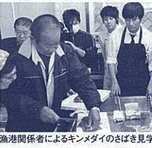
漁港関係者によるキンメダイのさばき見学

これらの活動は、生徒が地元の優れた食材などを再認識する機会となり、地元への愛着をはくむ