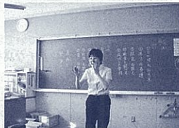
合唱を指揮する筆者

子どもとともに大まかな見直しをします。単元終了後に1時間ごとの振り返りを表にまとめました。教科の特性上、振り返りを整理することが、次の単元への見直しにつながるということがわかりました。