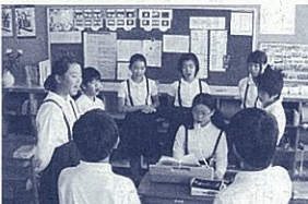
単元の終わりをまとめて見直しの表を作る(算数の授業より)

「個性あふれる、創造力豊かな子の育成」をめざし、研究を続けて27年目になります。近年は、見直しと振り返りに視点をあて、思考力の向上を目指した実践を行っています。