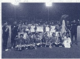
静岡中央高校サッカー部 優勝カップポーズ!!

定時制を英語に直すとpart timeであり、時間を区切ってという意味があります。定時制といえば、夜間というイメージがありますが、この3校の単位制定時制高校では、その言葉通り、午前、午後、夜間の3つの学習時間帯の中から、都合の良い時間帯を選んで学ぶことができます。夜間だけでなく、他の全日制課程の生徒と同様に、朝から学校に登校して勉強することも可能です。また、学習とスポーツ活動や自分の能力開発とを両立しながら通学することもできます。例えば、プロ棋士を目指してリーグ戦を戦いながら、また、映画やミュージカルに出演しながら学習と両立させている生徒もいます。