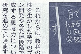
聴くことについて板書して考える

また、近年高校教育においてキャリア教育が重要な視点になってきています。この小冊子がひとつのツールとなり、地元の方々の交流や学校外での活動に微力ながらも役立つのではないかと考えました。