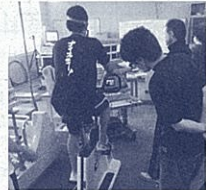
神奈川工科大学での体力測定

稲取高校は、平成26年度より文部科学省の「スーパー食育スクール」事業に指定されています。平成22年に東伊豆町の食育推進計画が策定されたのを受け、稲取高校で