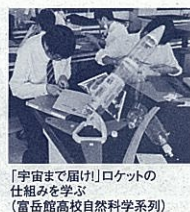
「宇宙まで届く」ロケットの仕組みを学ぶ(富岳館高校自然科学科)

ダンスなどを行い、自己の進路への自覚を深めていきます。その後、2、3年次には、様々な分野の幅広い選択科目の中から各自の興味・関心、進路目標に合わせて「自分の時間割」を完成させ、主体的に学習を進めていきます。