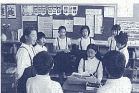
リーダーを中心にパート練習(朝の会より)

また、近年高校教育においてキャリア教育が重要な視点になってきています。この小冊子がひとつのツールとなり、地元の方々の交流や学校外での活動に微力ながらも役立つのではないかと考えました。