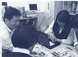
小冊子制作の様子(筆者・左)

私の勤務する下田高校では、「自己を知る」と「地域を知る」ことを目標に総合学習を展開しています。「自己を知る」では、各生徒が個性や特性を理解した上で大学等の上級学校の研究を行い、将来の進路選択に生かすことを目標としています。「地域を知る」では、自分たちが生まれ育った伊豆南部地区の歴史や文化を学び、その良さを再認識することを目標としています。下田高校は、下田市にある唯一の高校です。地元の方々の地域の高校生と共に活動したいという声は、社会の変化を受けて、年々大きくなっています。