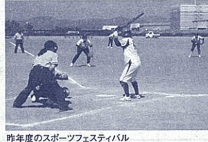
昨年度のスポーツフェスティバル

種目もあります。開催期間は、5月から12月となっており、毎年7万人を超える方が参加して下さっています。 http://www.japan-sports.or.jp/shizuoka/