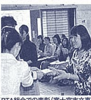
PTA総会での表彰(富士宮市立東小学校)

さと訴えました。参加者からは、「夫にも読み聞かせを勧めてみたい」等の感想が寄せられました。同園では、今後も読み聞かせの輪を一層広げる取組を進めるといっています。