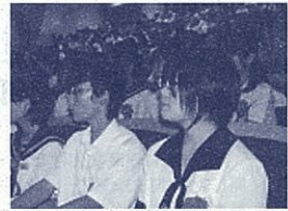
発表者の主張を真剣に聞く中学生

問い合わせ先・願書配布 〒420-8601 静岡市葵区追手町9-6 県庁西館7階 県教育委員会特別支援教育課 054(221)3329 054(221)3558