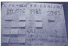
Cさんへのサポート方法