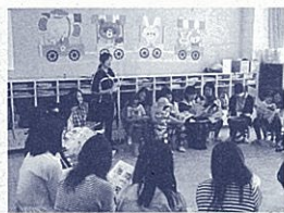
保護者懇談会(磐田市立豊田東幼稚園)

「相互理解のために」(日程・会場) ○8月4日(火) 伊豆市 生きいきプラザ(伊豆市)