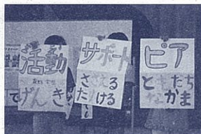
ピアサポート活動を分かりやすく説明