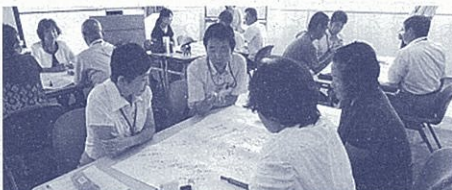
平成26年度学校・地域の連携推進研修会(下田市会場)