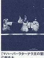
「マハー・バラタ・ナラ王の冒険」