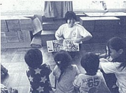
図鑑に読み聞かせている中学生

出口となる旭が丘中学校の「求める子ども像」を目指し、校区共通実践を12年間を見通した縦軸の指導が強化されました。道徳の授業では、生徒指導と連携した「いじめ」に関する授業など、校内携による活動等の確認と見直しを行うとともに、12年間を見通した指導を「いじめゼロ宣言」を書き、月に一度宣言の確認の