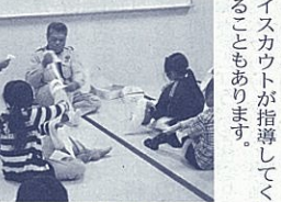
ボーイスカウトによる応急手当の実習

両校をつなぐ「掲示板」 南の丘分校は校舎の1階を使っています。生徒昇降口は駿河総合と共有で駿河総合の生徒が毎日教室の前を通っていき、職員室も廊下を隔して斜め向かいの配置です。両校がより分かりやすいためには日常的な情報発信を大切にしていきたいと思ひ、職員室前に大きなホワイトボードを設置しました。ホワイトボードには、その日の予定や、南の丘生徒への情報伝達と行事などの写真の掲示、また、駿河総合の取組を南の丘の生徒に紹介するコーナーもあります。