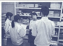
印刷作業を指導中の筆者(右から2人目)