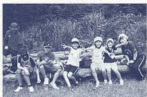
富士山の麓で仲間と共に

◇期日 事前研修会 7月5日(日) メインキャンプ 8月6日(木)～14日(金) ◇内容 川遊び、カヌー、マウンテンバイク、富士山原生林ハイキングなど ◇対象 小学校3年生(定員42人)、中学校3年生(定員42人) ◇参加費 4万円 ◇申込締切 5月29日(金) ★〒418-0101 富士宮市根原一帯地 0544(52)0321