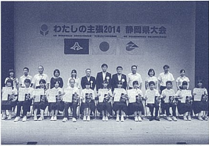
昨年度の大会で自分の思いを熱く語った13人

◇期日 事前研修会 8月2日(日) メインキャンプ 8月18日(火)～23日(日) ◇内容 いかだ作り、スイカ割り、着衣泳、浮遊体験、湖岸散策など ◇対象 小学校5年生、中学校1年生(定員80人) ◇参加費 1万9千円程度 ◇申込締切 6月9日(金) ★〒431-1402 浜松市北区三ヶ日町 054(221)3305