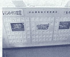
いじめをなくすための私の宣言

の配布、幼小中高による校区合同学校保健委員会の実施、のぼり旗掲出などの様々な取組を実施することにより、学校と地域・保護者とのつながりを深めることができました。