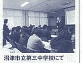
沼津市立第三中学校にて

〒420-0856 静岡県葵区駿府町1-70 静岡県総合社会福祉会館4階 (静岡県健康福祉部地域福祉課人権同和対策室) TEL054(221)3330-2303 FAX054(221)1948