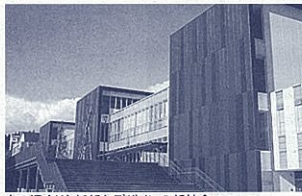
木の温もりと新デザインの新校舎

掛川特別支援学校は、「つながり合い、学び合う」を教育理念に掲げ、すべての人が地域の中で自分らしく、つながり合って生活し、共生社会の推進に貢献できる学校を目指します。