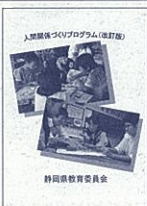
静岡県教育委員会

★「改訂のポイント」は、小1、小2、中3のプログラムを新たに加え、全校で取り組むことができるところになりました。 ★学級活動だけでなく、道徳・総合的な学習の時間、保健体育、外国語活動等で幅広く活用できるようにしました。 ★「改訂のポイント」は、小1、小2、中3のプログラムを新たに加え、全校で取り組むことができるところになりました。