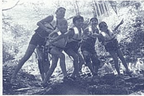
仲間とともに自然を満喫

◇期日 事前研修会 8月2日(日) メインキャンプ 8月18日(火)～23日(日) ◇内容 いかだ作り、スイカ割り、着衣泳、浮遊体験、湖岸散策など ◇対象 小学校5年生、中学校1年生(定員80人) ◇参加費 1万9千円程度 ◇申込締切 6月9日(金) ★〒431-1402 浜松市北区三ヶ日町 054(221)3305