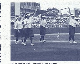
大会旗を持って堂々の行進

旧静岡市立商業高等学校、さらには南の丘分校との共生・共育を続けてきた旧県立静岡南高等学校の実績があればこそ依頼を感じました。私はこれまで高学校野球の保護者として、卒業したばかり。注目度の高さが十分に伝わっていただけに、「瞬迷いながらも南の丘の生徒でしたが、南の丘の生徒ならきっとできる」と思いました。