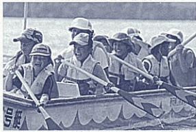
真夏の太陽の光を浴びてカヌー体験

◇期日 プレスクール 7月19日 ◇対象 小学生5年生、中学生3年生 ◇参加費 1万円程度 ◇申込締切 6月5日(金) ★〒425-0041 焼津市石津2259-408 054(62)4675