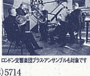
ロンドン交響楽団「プラマス・ザンブル」も対象です