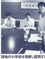
現地の小学校を視察し質問する参加者

1面では、新しく開校した3校の紹介を掲載しました。新しい学校、新しい仲間とともに、新たな1ページを切りあげてほしいと思います。5月の連休も終わり、心も体もフレッシュできたらどうでしょうか。