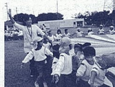
運動会ごっこ(筆者)

本園の子どもたちに 行った調査では、家庭で はテレビを見たりゲーム をしたりして過ごし、園 には車で送迎する家庭が 多いという実態が明らか になりました。