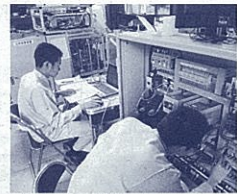
納品する製品の性能テストをする筆者(左)

ました。 学校現場に戻った今、研修で学んだことを生かせるよう、次のことを意識しています。