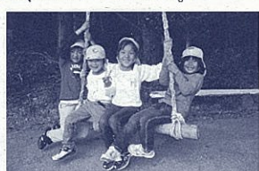
里山には遊び場がいっぱい

子どもたちの興味をそ る環境がこの里山には たくさんあります。体力 作りとともにたくましく 心を育て、故郷を大切に 思う気持ちを育てること にもつながっています。