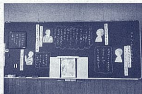
二人の心情を考えよう

気賀小学校では、「生き る力を育てる気賀小教育 の実現」を教育目標に研 修を進めています。その 中の道徳での実践を紹介 します。