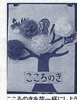
こころのきを花一杯にしよう

低学年では、多様な考 えを引き出すために役割 演技を行いました。お面 を付けて主人公になり きって動作化をするこ とで、主人公の迷いや葛藤 新しい価値に気付いたと きの心地よさに共感する ことができました。