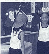
しまのおさるに変身!

高学年では、年間と同 じ形式のワークシートを 活用しました。今までの 自分から今の自分とい う題で自分の心の軌跡の 振り返りを行いました。 自分へのメッセージを書 くので自分の成長を実感 することができました。