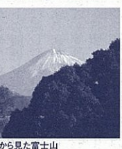
館内から見た富士山

なお、12月からは、貸室として利用可能ですので、公私を問わず、会議や研修等で部屋をお貸しの際には是非、御利用ください。(詳細は当館Webサイト等で御確認ください) 【中央図書館総務課】