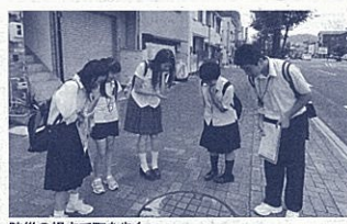
防災の視点で町を歩く