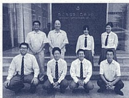
中国の青島にある水産会社への視察