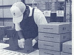
商品を入れる箱折り作業