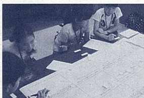
地震が起きたらどうなるだろう？

問・申 県総合教育センター 生涯学習推進室 〒436-0294 掛川市富部456 ☎0537(24)9715 9715 9715