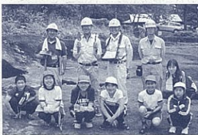
現地見学会(筆者後列左から2人目)

6月私は山間の小さ な小学校の隣で発掘調査 を行っていました。そこ で児童6人・教員2人の 現地見学会を開きました。 道路建設に伴う発掘調査