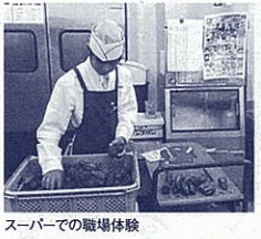
スーパーでの職場体験

本校では週1回4時間学校周辺の企業で働かせていただく「地域作業」を行っています。お豆腐屋、なまり節屋、本屋、新聞の折り込み業者、高齢者のデイサービス、スーパーなど様々な職種を体験できる貴重な学習の時間です。