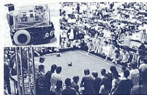
ロボット競技の世界大会(左上:生徒の作成ロボット)

入が目標として掲げられています。文科科学省の調査では、コミュニティ・スクールの成果として、地域全体で子どもを守り育てようという意識が高まったこと、保護者の「学校への見込み」が「意見や提案