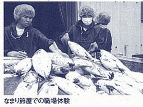
なまり節屋での職場体験

本校は、軽度知的障害のある高校生が通う開校2年目の特別支援学校です。全国で初めて水産高校の中に設置された分校でもあります。学区は志太・榛原地区で、生徒全員が一般就労を目指しています。「会社で働きたい」「一人暮らしをしたい」「そんな生徒の夢を実現するためにキャリア教育を推進しています。」