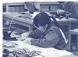
ものづくり競技大会(電子回路立役)

入が目標として掲げられています。文科科学省の調査では、コミュニティ・スクールの成果として、地域全体で子どもを守り育てようという意識が高まったこと、保護者の「学校への見込み」が「意見や提案