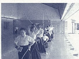
昨年の様子(弓道大会)

子どもたちは学校で教師と出会い、日々かけていくなか、子どもたちが「教える」「気づかせ」を繰り返して与えることで自身も成長できる、と学びました。