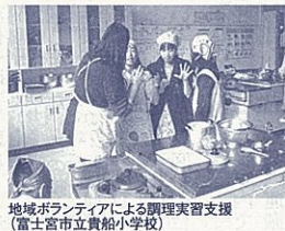
地域ボランティアによる調理実習支援(富士宮市立貴船小学校)

地域で学校を支援 地域住民が学校の教育活動を支援する「学校支援地域本部」が広がっています。平成25年度は、17市町33本部で対象校は129校(小学校88校、中学校41校)。学校と地域をつなぐ学校支援コーディネーターと熱心に活動して下さる地域ボランティアの方々の活躍と学校の教員の協力によって、実施校は昨年より40校増加しました。 こうして学校支援地域本部がなくても、県内のほとんどの学校で、地域の支援を受けた教育活動を行っています。しかし、コーディネーターまで配置して、地域の方を交えた会議を持つている学校はまだ全体の半分程度です。 学校では、地域の方にグスタティチャー等を依頼するだけではできませんが、広いネットワークがあれば、地域の力を上手に引き出して、より豊かな学校支援を提供することができます。水泳や書写、調理・ミシンの指導、環境整備、登下校見守り等、コーディネーターは、子どもたちのために協力したいと思っている地域の方々を発掘して、学校