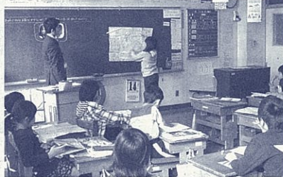
お店と地域住民とのつながりについて考える授業(筆者左)