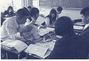
グループで課題に取り組む

再び全体をコの字型にすると、板が見えにくい、グループでは「一人で考えた意見」が「話し合うのが苦手」といったものでした。私にとって協同学習の難しさは話し合うテーマの設定と生徒の意見をくみ取る力だと感じています。教材研究を丹念に行わないと適切なテーマの設定はできませんし、教師の側に「ゆとり」がないと生徒の意見をくみ取ることができません。生徒のつばやきを拾い上げ、紡ぎ、発展させる、そんな授業を目指していきたいと思えます。