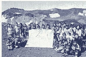
日本一の山頂にて