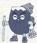
日本のテッペンまでもう一息