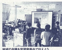
地域の自慢を学習発表会で伝えよう