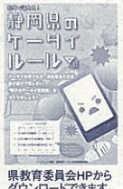
県教育委員会HPからダウンロードできます。

家庭においては、静岡県教育委員会発行の「親子で話そう!静岡県の子スタイル」を活用し、親子での話し合いを通じて携帯電話を利用する際のルールを決めるとよいでしょう。