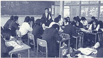
机をコの字型にし、聞き合う雰囲気を作る