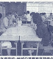
平成24年度学校・地域の連携推進研修会

このように学校支援地域本部がなくても、県内のほとんどの学校で、地域の支援を受けた教育活動を行っています。しかし、コーディネーターまで配置して、地域の方を交えた会議を持つている学校はまだ全体の半分程度です。 これからは「学校が地域にサポートしていただく関係」から、「学校と地域の双方にメリットのある関係」となるように、学校の意識の変換が求められています。 学校も地域も「一緒にやってみよう」という気持ちで、連携の意欲はさらに増します。学校は「地域の学びの拠点」となると、地域の教育力向上に貢献できるのではないのでしょうか。