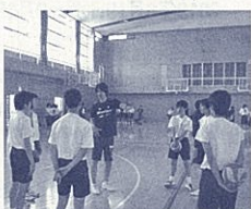
派遣された講師による支援(掛川西中学校)