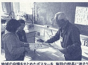
地域の自慢をまとめたポスターを、施設の館長に渡そう