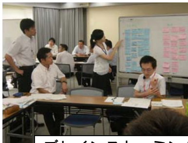
ブレインストーミング