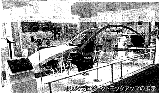
NCVプロジェクトモックアップの展示