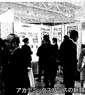
アカデミックブースの新設