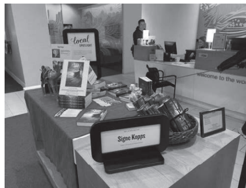
銀行のロビーは、市民が自由に休憩できる雰囲気