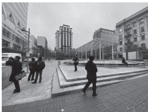
ディレクターパーク

ポートランドに点在する都市公園の一つである「ディレクターパーク」を訪れた。公園のまわりには店舗が多く設けられており、公園に向けて一階部分を店舗にすることで、公園敷地と店舗空間に一体感が生まれ広々とした空間形成に繋がっている。ポートランドでは賃貸物件を整備する場合は、必ず一階部分の50%を店舗にしなければならない。また、近年増加する人口に対応するため、20%を中低所得者向けの住宅として整備することも義務づけられている。中低所得者へ貸し出す場合は家賃の差額を市が補填する。所得層で住むところが分断されることを良しとしない考え方によるものだ。ディレクターパーク内には自然な形で観光案内所が設置されている。FreeWifiのみならず、無料の給水所（ボトルに水を補給できる）なども完備されているあたりが、いかにも環境を重視するポートランドといったところだ。