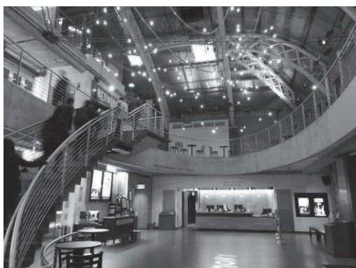
歴史的建造物をうまく活用