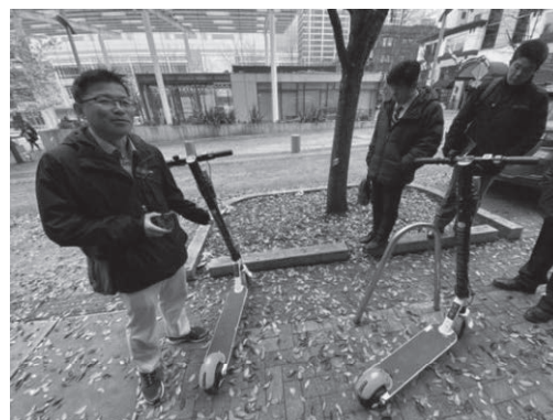
電動キックボードも利用可能

電動キックボードの新しい公共交通機関の取組も行われていた。スマートフォンでアプリをダウンロードし、電動キックボードのQRコードを読み取ることで利用を開始できる。電力は充電を専門にするアルバイトの方が夜間に充電をしているという。