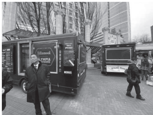
公園内はキッチンカーも出店

パイオニアコートハウススクエアに敷き詰められたレンガの一部には、この公園整備のために寄附をした方の氏名が刻まれており、アメリカの寄附文化の一端に触れることができる。