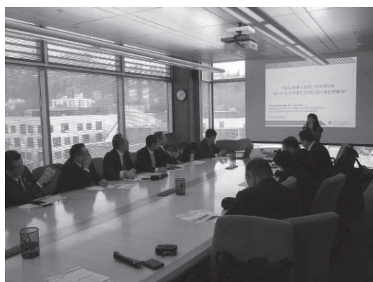
ポートランド州立大学の革新的な取組の説明