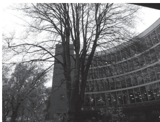
中央の木は大学のシンボルの1つ (図書館拡張時に学生の声によって残された)