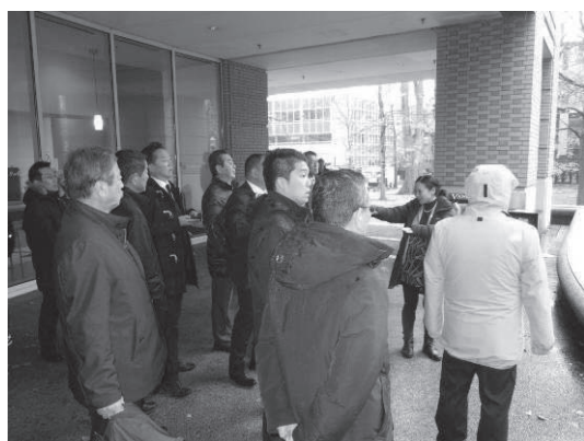
大学のキャンパス内の説明

行政もNA加入者、街づくり団体等との連携することで、幅広く意見を集めることができる。ポートランドの場合、白人がどうしても多い。NAだけだと白人意見が多くなってしまうため、様々な団体とかわるようにした。日本では公平性という大義のもとに、市民団体とは少しディスタンスがあるのではないかと。いろいろな意見が聞こえるようになる仕組みが大切である。