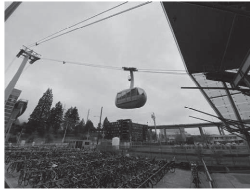
ウォーターフロント地区の風景

ウォーターフロント地区からダウンタウンまでを自転車道で結ぶ計画があり、公共交通機関と自転車で街の至るところを行き来できるようになる。