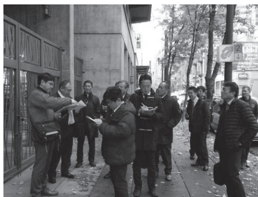
柳澤氏からまちづくりの説明