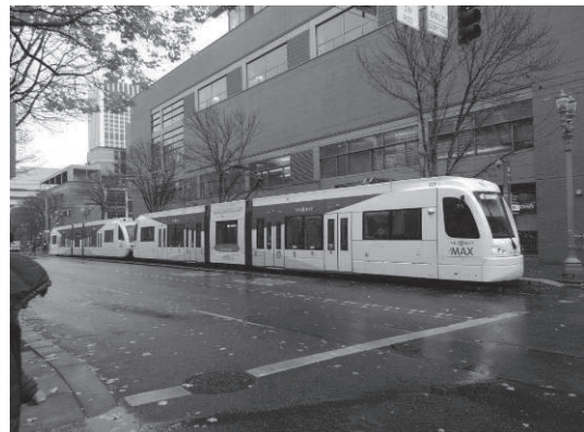
ポートランドの充実した公共交通の1つであるマックス・ライトレイルを利用する調査団