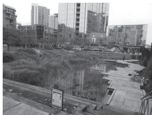
街と公園との調和も

ポートランドは「歩いてまわれるまち」であることが魅力の一つだと痛感した。また、路面電車（ライトレールMAX）も充実しており、高齢者の交通手段としても優しいまちである。さらに、健康都市（ヘルスケア）としての側面もあり、歩くこと、そして、自転車人口が多い街でもあることによる生活のなかでの健康づくりが浸透している。