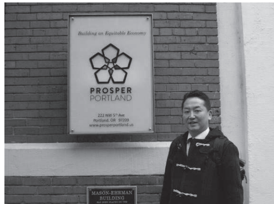
プロスパーポートランド玄関前で筆者