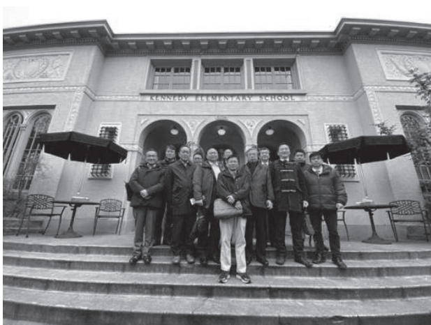
ケネディスクールの前で

ポートランドの街は一言でいうと居心地が良い。それは、歩行者目線で街が形成されているからであり、賑わいがあり、人の呼吸を感じずからである。街づくりの哲学として「無駄を作らなければならない」という考え方があると聞いた。無駄があることで、住む人の心に余裕が生まれるという。ポートランドはその街に住みたい一心で仕事も無いのに越してくる若者がいるという希有な街である。住みやすさの追求がそのような結果を生むということを教訓として、静岡県地域戦略に活かしていきたい。