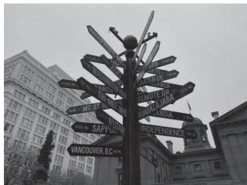
案内所や姉妹都市への案内板

パイオニアコートハウススクエアをはじめ、ポートランドの市内ではキッチンカーを見る機会が多い。キッチンカー出店の許可は比較的容易に取れる上に、自営業としての開業を積極的に支援することで、若い人の就労のメジャーな選択肢となっているようだ。パイオニアコートハウススクエアには観光案内所や姉妹都市との距離を示した象徴的な看板などが設置されている。バスやライトレールなどの公共交通機関の停留所も隣接しており、観光の起点としての位置づけが明確になっている。