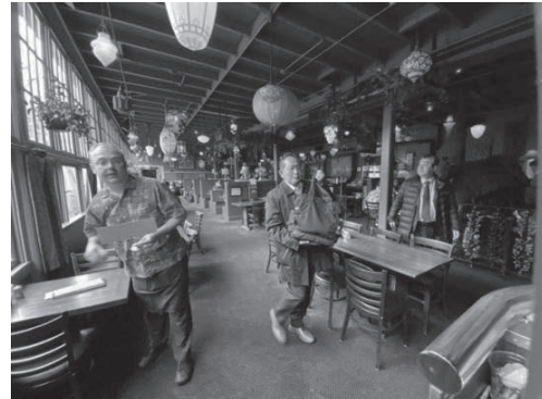
小学校の雰囲気を残しながらリノベーション

体育館をリノベーションしたシアタールームではNPOのファンドレイジング（活動のための資金等を集める行為）の講演会が開催されており、写真は撮影できなかったが、100人程の席は満席となっていた。そうした講演会や勉強会に参加した人たちを十分に収容できるだけのレストランが完備されており、非常に良い雰囲気で地域の核となる施設として機能していることが良く分かった。