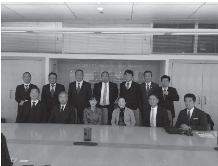
西芝教授等とともに 筆者（前列右端）

以上のことから、視察でヒアリングできたことがすべて日本に置き換えられるというわけではないが、トライ&エラーの繰り返しの中で方法を見出しながら住民の自治意識と行政のベクトルができるだけ同じ方向を向くことができるように、微力ながら地方議会議員の一人として務めていきたい。