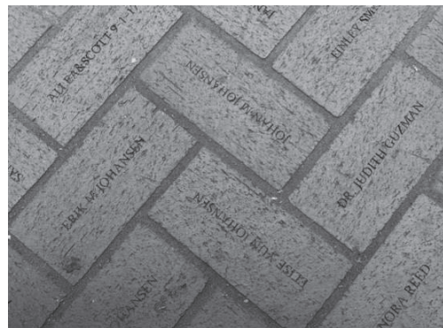
パイオニアコートハウススクエア 地面には広場整備への寄附者の名前が刻まれている