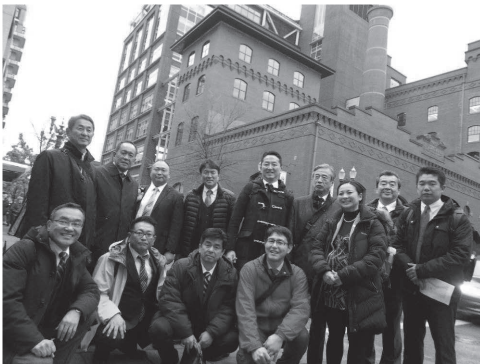
ビール工場からクラフトビアのレストランにリノベーションした店の前で

まちを实际歩くことで、様々なまちづくりの戦略を感じ取ることができた、とても充実した内容であった。これも、ポートランド州立大学や PP が核になってよりよいまちづくりを研究し続けているポートランドのすごさでもあると痛感した。「まちづくりは戦略的なランドデザインの構築と市民意識の醸成」であると痛感した視察であった。