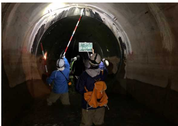
損傷等の点検の様子

今回の点検では、補修箇所の破損の進行及び新たな損傷等の発生は見られませんでした。