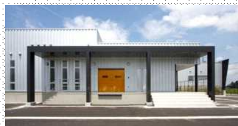
▲完成イメージ外観