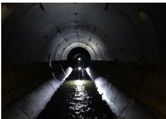
トンネルの中の様子