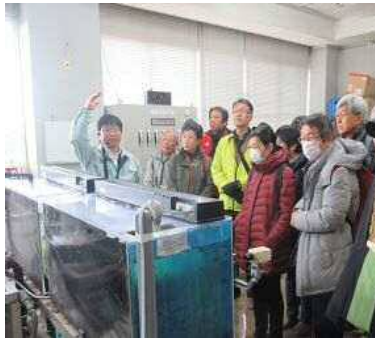
中島浄水場見学の様子