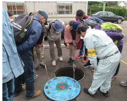
堂庭取水場見学の様子