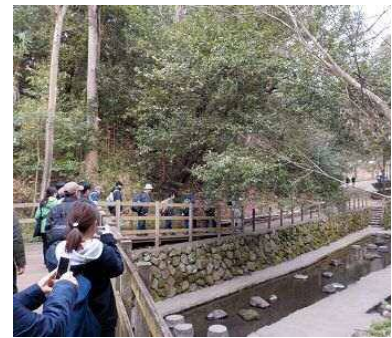
柿田川公園散策の様子