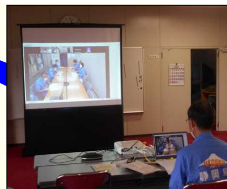
事務所から Web で報告