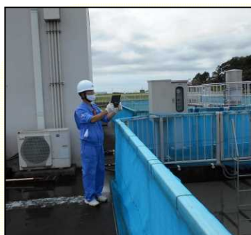
被災現場から Web で報告