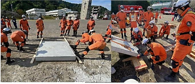
都市型搜索救助Ⅳ「クリッピング・ムービング」