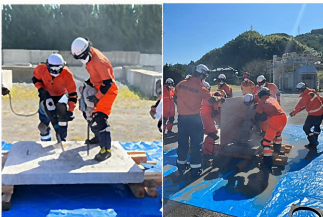
都市型搜索救助Ⅱ「ブリーチング」