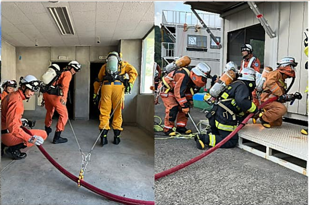
火災救助Ⅱ「屋内進入・検索救助訓練」