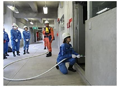
屋内消火栓放水訓練