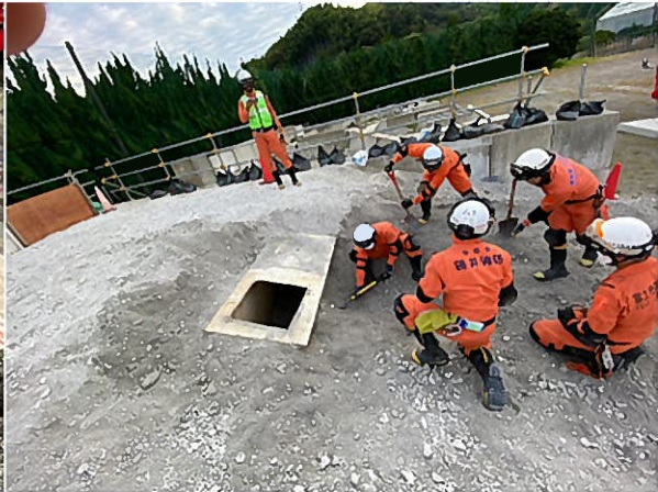
震災時対応訓練「震災想定訓練」(災害救助犬静岡)