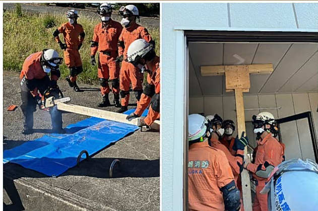
都市型搜索救助Ⅰ「ショアリング」