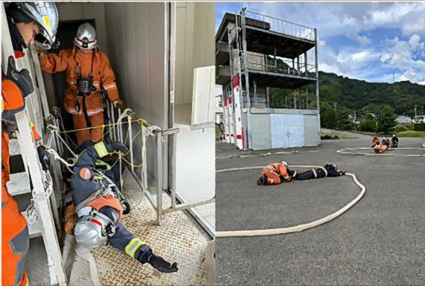
火災救助Ⅰ「緊急時対応訓練」