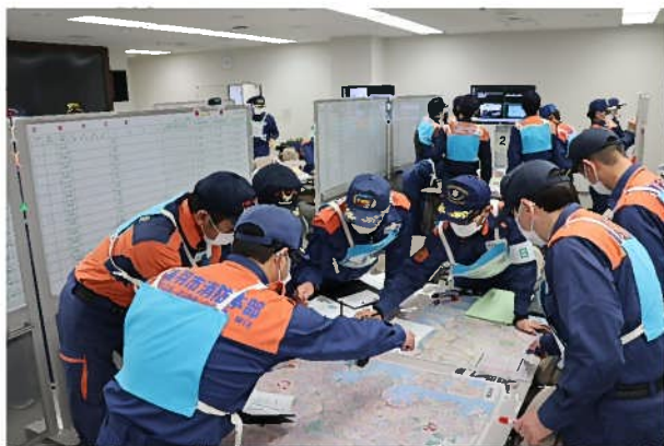
指揮シミュレーション訓練