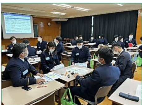
講義の様子(グループワーク)

そのために、県内外から予防業務に専従している消防職員や、消防設備に精通している民間企業、危険物化学の大学教授。また、消防業務のDX化を推進していく上で一助となる講師を招き、幅広く専門的な教育を実施しました。