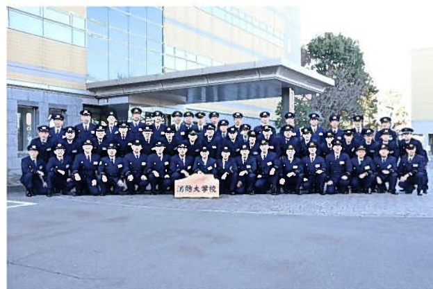
全国から集まった同期学生

令和6年1月15日（月）から3月1日（金）まで、消防大学校の幹部科（第76期）に入校しました。