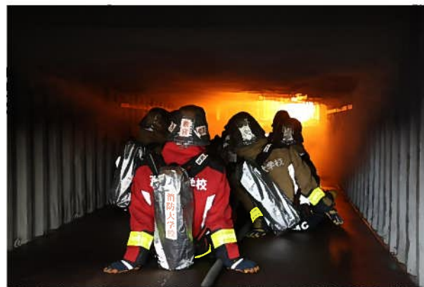
実火災体験型訓練