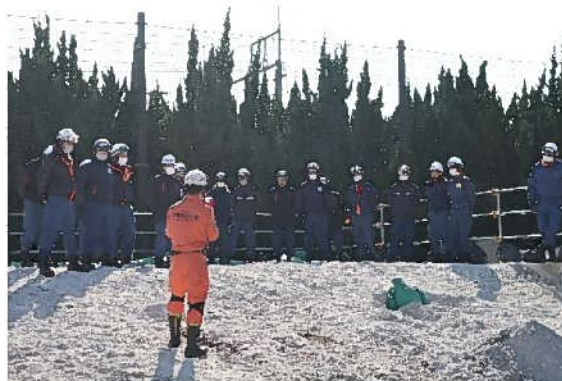
訓練施設を使用した講義（土砂災害対応）