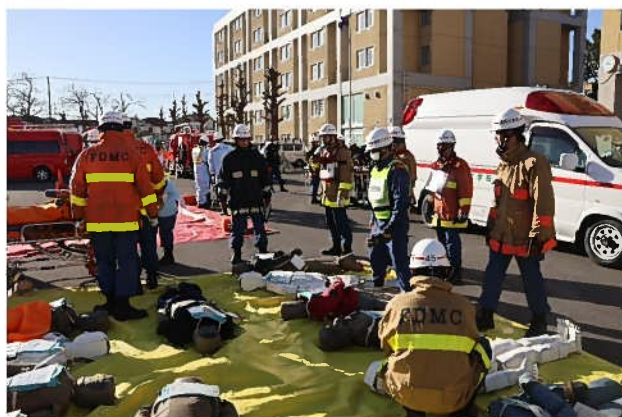
多数傷病者対応指揮訓練