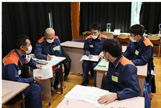
グループワーク風景（テロ災害対応）

本講習は、大規模災害発生時において必要な、情報収集能力及び指揮能力を習得するとともに、的確な安全管理の下、円滑に活動が遂行できる専門的知識、技術を習得することを目標に実施されました。