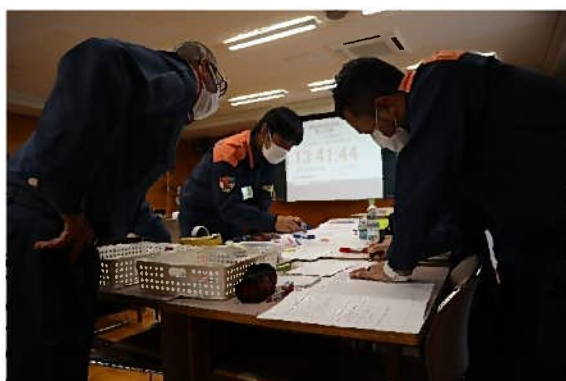
図上訓練風景（地震災害）