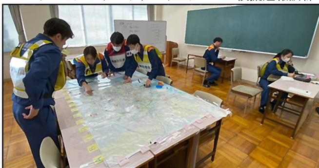
図上訓練(システムダウン想定)の様子