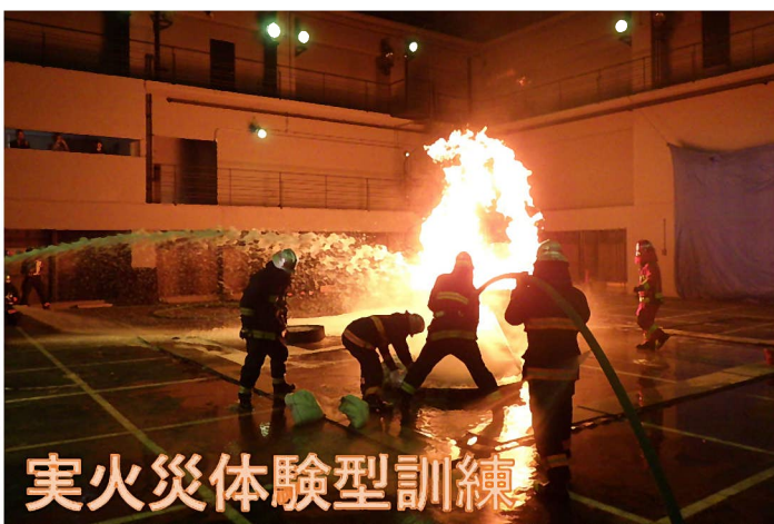
実火災体験型訓練