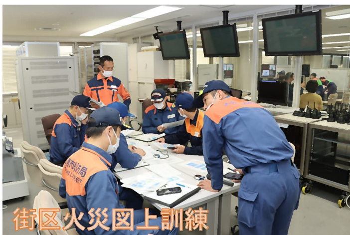
街区火災図上訓練

令和5年10月26日（木）から12月15日（金）まで、消防大学校の警防科第113期に入校しました。消防大学校の専科教育である警防科は「警防業務に関する高度な知識及び技術を専門的に修得させ、警防業務の教育指導者等としての資質を向上させる」ことを目的とし、警防業務に関する知識、技術、戦術・現場指揮の重要性、活動要領及び安全管理並びに教育技法についての講義や実技がカリキュラムとして組まれています。