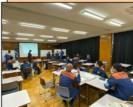
コミュニケーションスキル・ディスカッション

4日間という短い講習期間でしたが、指令センターとして必要なスキル向上のために、多岐にわたる講義、多様な模擬訓練を実施しました。