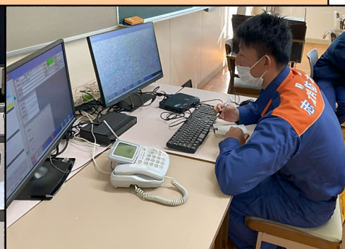
模擬通報訓練<指令員役>