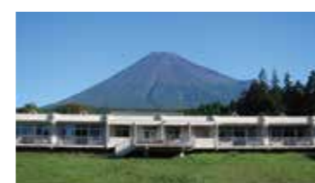
社会福祉法人誠信会 特別養護老人ホーム 富士楽寿園

災害時には、受入れ可能な人数を富士市に連絡します。富士市認可の緊急通行車両があるので、これをフルに使って対応します。また、停電でも使用できる MCA 無線、衛星回線ネットなどの通信設備も非常時に役立つでしょう。