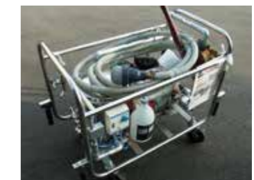
特注製作の緊急用浄水装置。年に一度、作動させて職員に使い方を教えている

当園の敷地内には井戸水があり、3基のタンクに合計360tの水を貯めることができます。また、緊急用の浄水装置も用意しています。さらに食糧の備蓄が2週間分、テントも10張以上あります。大規模地震が起きたら、これらを地域の方たちに使ってもらい、力を合わせて災害に立ち向かいたいと思います。