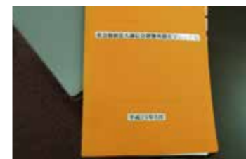
地域との防災協定に基づく避難所運営マニュアルを作成