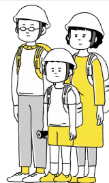
防災ベテラン家族「わだひな家」