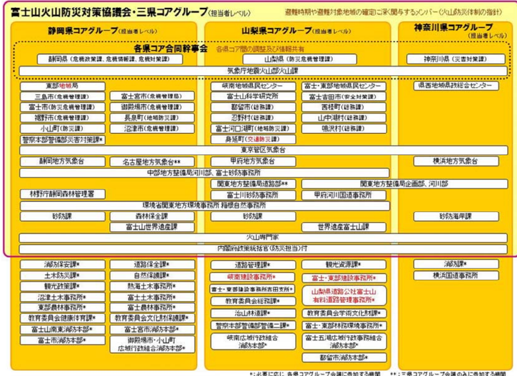
図 1 富士山火山防災対策協議会の構成