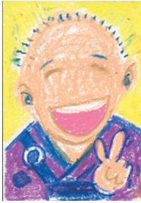
富士宮市 地域防災指導員