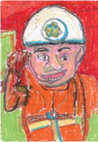
元菊川市消防団員