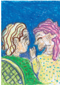
菊川市 民生委員児童委員