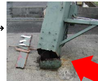
折れた柱の根元。点検口のボルト穴からサビが入り腐食して、鉄骨が破断した。

交通の激しい沿道で看板の柱が折れたが、隣地の看板が支えとなり、道路への倒壊を免れた事故。電線を切断すると停電による損害賠償額は膨大な金額になることも。