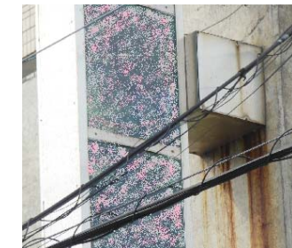
←ブラケット下に汚ダレが見られると、内部の取付金具にサビや腐食の可能性もある。