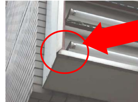
←パネルの変形、ズレ、破損の他、パネルの押さえ枠が変形し落下する場合も。

表示パネルの四方を押さえ枠で固定する欄間看板。複数枚のパネルを使用する場合は、隣り合うパネル同士をきちんと固定しないと、振動や風などで落下する恐れがあります。