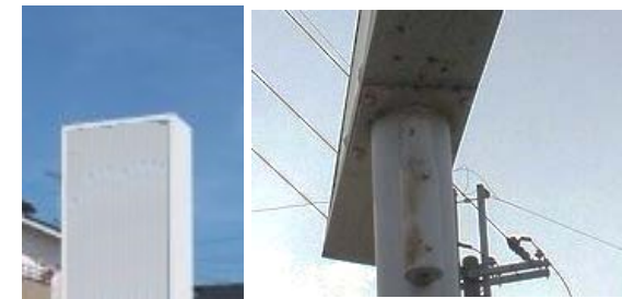
↑看板本体からポールへの汚ダレがあると、接合部にサビや腐食が進行する恐れ。