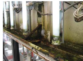
↑内照式看板内部の腐食、部材の腐食器具の劣化による出火の恐れも。