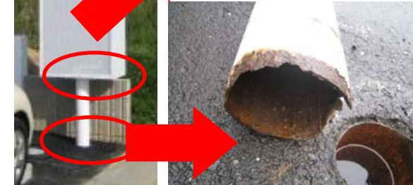
↑柱根元のサビを放置し、倒壊。

倒壊・落下の危険を見つけたら! ◆付近を立入禁止にし、見張りを置く。 ◆信頼できる屋外広告業者に連絡。 ◆人通りの多い場所では警察にも連絡。