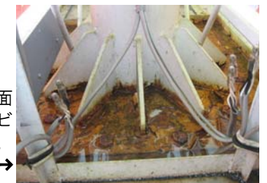
看板の根元がカバーで覆われている場合、表面はきれいでも内部でサビが進行している恐れも。