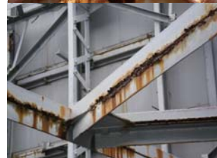
↑内部鉄骨のサビ・腐食。