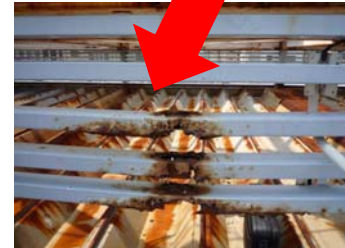
↑目隠しルーバーのサビ・腐食。