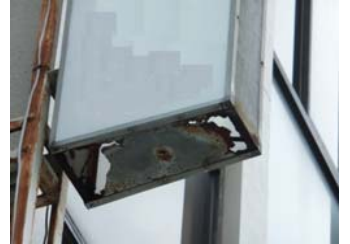
↑看板底部の留め具が壊れるとアクリル板が抜け落ちる原因にも。