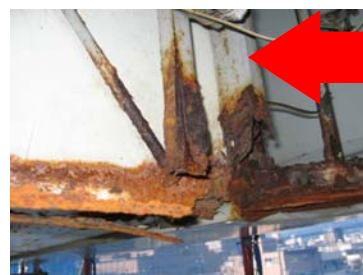
↑板面裏側のサビ、腐食。サビによる腐食はミルフィーユ状に剥がれ崩落する恐れも。