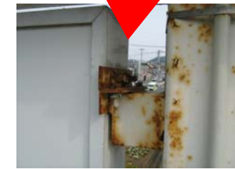
←取付金具のサビや腐食。ボルトやビス等が欠落していたら緊急の対応が必要。放置すると看板が落下する恐れも。