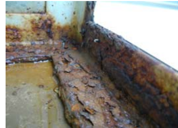
↑看板面（アクリル板）のひび、割れ、ゆがみ板面の落下により、内部に水が入り腐食する原因に。