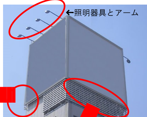
←照明器具とアーム

外照式の屋上看板では照明器具のアーム接合部の腐食やボルトのゆるみがあると器具が落下する恐れがあります。