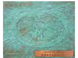
受賞記念プレート プレートデザイン/川口宗敏

H20)が、農村景観初の最優秀賞を受賞しました。この他にも「上倉沢の棚田」(菊川市、H20)、「静岡の原風景」(富士山麓の茶園) (富士市、H21)、「大井川沿いの茶畑とS」(川根本町、H22)など、静岡を代表する農村の景観が受賞しました。また、これまでは、行政単独または民間と行政の共同受賞が多かったのですが、住民や企業の景観に対する意識が高まっていったことから、「遠州横須賀のまちづくり」(H25)、「大社の杜みしま」(三島市、H26)、「坂口谷川環境美化活動」(牧之原市、H27)などのように、受賞者の多くが地域住民や地域企業となり、地域の景観は地域で創るという景観形成の本来の姿が顕著に現れてきました。