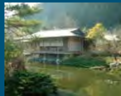
1991年 藤枝市 玉露の里