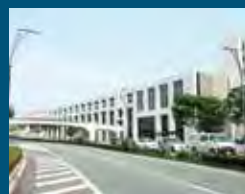
1993年 富士市 富士市文化会館 「ロゼシアター」とその周辺