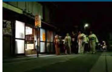
平成11年から始まった「ちっちゃな文化展」

東名掛川ICから車で20分。毎年4月の第1週に開催される「遠州横須賀三熊野神社大祭」、10月の第4週に開催される「遠州横須賀街道ちっちゃな文化展」は、いずれも地元の人たちによって運営され、大勢の観光客を集めている。