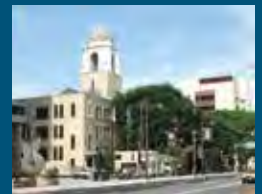
1989年 静岡市 静岡市庁舎本館