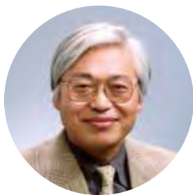
平成29年11月 静岡県景観賞審査委員長 静岡文化芸術大学名誉教授

それは、不可能ではありません。 我々が更に続けて70年間、この景観賞を継続するに値する努力をすれば、全国いや世界から注目される「美の国・静岡県」になれるのではないのでしょうか。