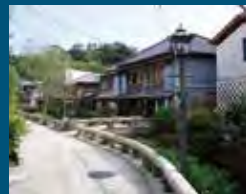
1994年 下田市 ペリーロード