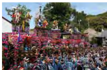
桜の咲く季節に行われる「三熊野神社大祭」

独特の裡里(ねり)を曳き回すなど文化的な価値も大きい三熊野神社春大祭についても、「文化を守るためにやってきたわけじゃない。大好きな祭りを、仲間たちと本物志向で楽しんでいたら文化になっていった」と笑う。