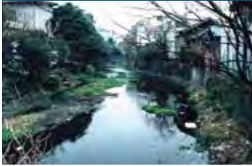
環境悪化が進行した1980年代の源兵衛川

三島駅から徒歩5分。 富士山からの湧水を水源とし、楽寿園内小浜池から中郷温水池まで全長1.5kmにわたる源兵衛川。この源兵衛川を中心に周辺の再生が行われ、今も美しい水辺の風景を守り続けている。