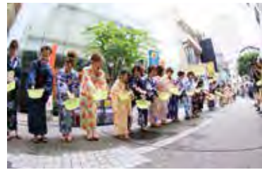
にぎわいを見せる「てんま夏祭り」の一場面

そこを歩くだけで背筋がピンとする。晴れやかな気分させてくれる。静岡市の中心街にある伝馬町けやき通りには、そんな不思議な力がある。休日ともなれば、思い思いのお洒落に身を包んだ人々が行き交うこの通りも、ほんの20年ほど前まではどこにでもある裏通りに過ぎなかった。