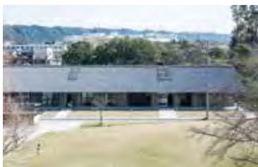
隣接する公園から見た豊岡中央交流センター

新東名遠州森町スマートICより車で約20分。東名磐田ICから車で約25分。豊岡総合センターの一角にある施設は、地域の皆様の交流拠点として機能している。 住所：磐田市壺貴地76-5