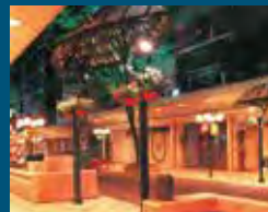
1992年 静岡市 静岡市七間町通り