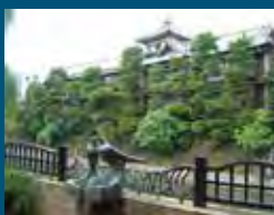
2002年 伊東市 温泉文化香る東海館界隈