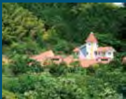
2000年 掛川市 森に抱かれた ねむの木村の施設群