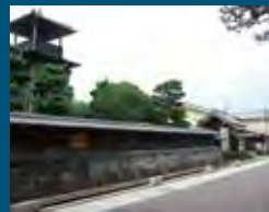
1995年 静岡市 由比本陣公園と街並み