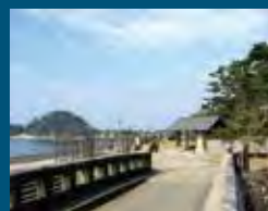
1996年 沼津市 沼津御用邸記念公園と その周辺地区