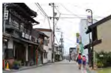
遠州横須賀街道の日常風景

「この町には、どのおばあちゃんか、どの方向に頭を向けて寝ているかも知っているほどの濃い人間関係が今も残っています。しかし昭和の中頃、昔ながらの軒を寄せ合う家々が建て替えの時期を迎えると、雨水の処理だとかトイレの位置だとか、些細なトラブルが散見されるようになりました。そんなことで江戸時代から続く