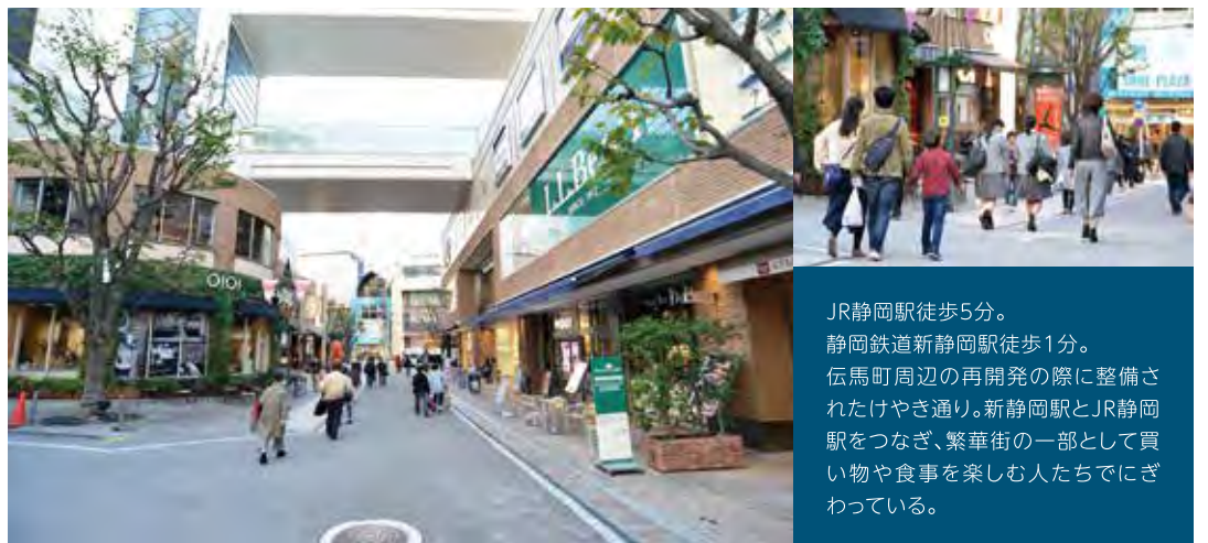
歩行者を大切にする雰囲気は今も変わらない。

JR静岡駅徒歩5分。 静岡鉄道新静岡駅徒歩1分。 伝馬町周辺の再開発の際に整備されたけやき通り。新静岡駅とJR静岡駅をつなぎ、繁華街の一部として買い物や食事を楽しむ人たちにぎわっている。