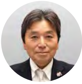
平成29年11月 美しいしずおか景観推進協議会会長 静岡県交通基盤部長

今後とも、協議会会員一同、県民の皆様とともに、美しいしずおかの景観形成に取り組んでまいりたいと考えておりますので、御支援、御協力をお願いいたします。