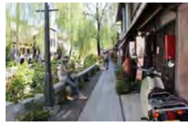
平滑川沿いの小径がとても心地よい。

「町に昔のよ うな活気を取 り戻したいと いう想いから、 平滑川をよく する会という 研究会を結 成し、民間主 導型の都市計 画を行政に対