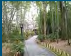
1997年 伊豆市 竹林の小径と修善寺回廊