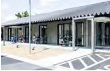
広い軒下によって生まれた憩いの場

新東名遠州森町スマートICより車で約20分。東名磐田ICから車で約25分。豊岡総合センターの一角にある施設は、地域の皆様の交流拠点として機能している。 住所：磐田市壺貴地76-5