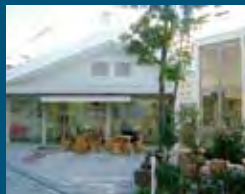
1998年 三島市 パン屋の街かど