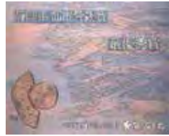
受賞記念プレート プレートデザイン/柳澤紀子