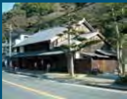
2001年 藤枝市 大旅籠柏屋と 歴史にぎわい空間