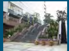
1988年 浜松市 サンクンガーデン