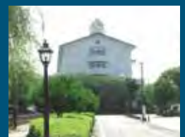
1990年 静岡市 市立城内中学校