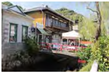
通りには石造りの蔵やなまこ壁を利用したお店が並び、散策する楽しみがある。

民と官が協力しながら取り戻したにぎわいは、20年を経た今も地域の人々に誇りと愛着を与え続けている。