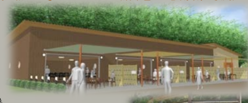
沼津垣：沼津に伝わる伝統的な竹垣（沼津の宝100選）

憩い・交流施設のイメージ 例：「和モダン」なオープンカフェ（沼津垣など地域資源を使用）