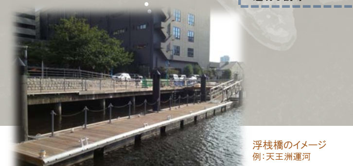
浮桟橋のイメージ 例：天王洲運河