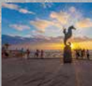
班德拉斯湾/墨西哥