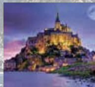
圣米歇尔山湾/法国