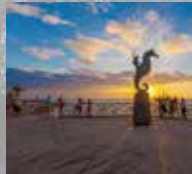
バンデラス湾/メキシコ