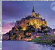
モン・サン・ミッシェル湾/フランス