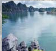
ハロン湾/ベトナム