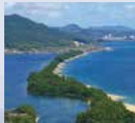
宮津湾・伊根湾/京都