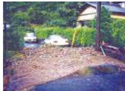
平成15年7月の大和田沢の土石流による被害のようす