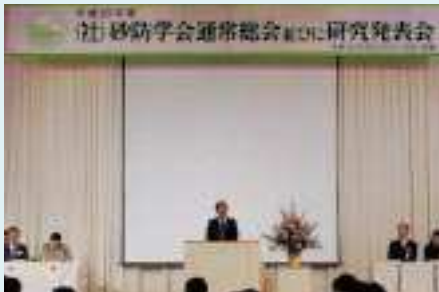
大久保砂防学会会長の挨拶

5月18日～20日にかけて、宮崎市にて砂防学会通常総会並びに研究発表会が開催されました。