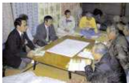
大和田地区の皆さん(第2回地元説明会H16.2)

ころ、昭和49年の七夕豪雨(84.5mm/時間、508mm/24時間)でも発生しなかった土砂災害が起こるとは、といった驚きの声も聞かれました。