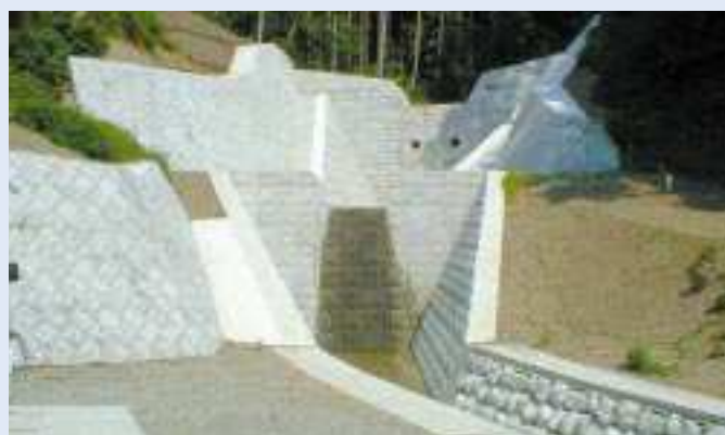
みとくぶしざわ 三津久伏沢砂防えん堤

事業名 / 火山砂防事業 箇所 / 賀茂郡松崎町雲見地先 期間 / 平成10～15年 事業費 / 272百万円 概要 / コンクリート砂防えん堤 H = 10.0m、L = 78.0m 事業効果 / 土石流による災害を防ぐため、砂防えん堤を施工し、人家49戸及び緊急輸送路(国道136号)の安全が図られた。