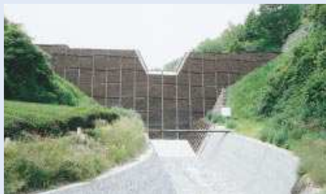
もつきざわ 目木沢砂防えん堤

事業名 / 通常砂防事業 箇所 / 焼津市吉津地先 期間 / 平成11～15年 事業費 / 272百万円 概要 / コンクリート砂防えん堤 H = 13.0m、L = 86.5m 事業効果 / 土石流による災害を防ぐため、砂防えん堤を施工し、人家28戸の安全が図られた。