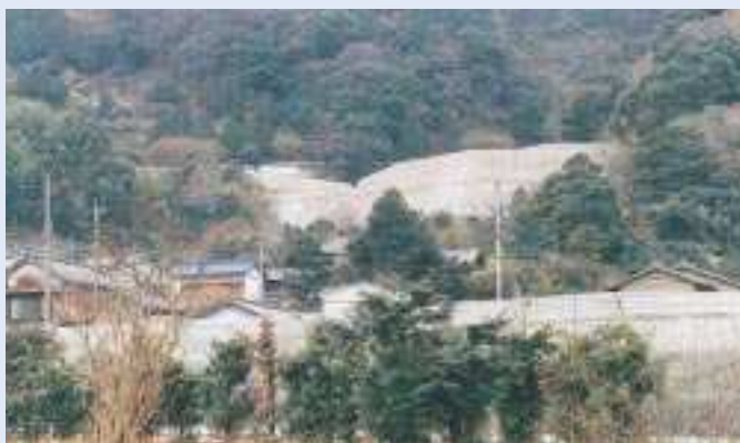
よしづがわ 吉津川砂防えん堤

事業名 / 通常砂防事業 箇所 / 焼津市吉津地先 期間 / 平成11～15年 事業費 / 272百万円 概要 / コンクリート砂防えん堤 H = 13.0m、L = 86.5m 事業効果 / 土石流による災害を防ぐため、砂防えん堤を施工し、人家28戸の安全が図られた。