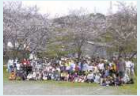
作業終了後の記念撮影