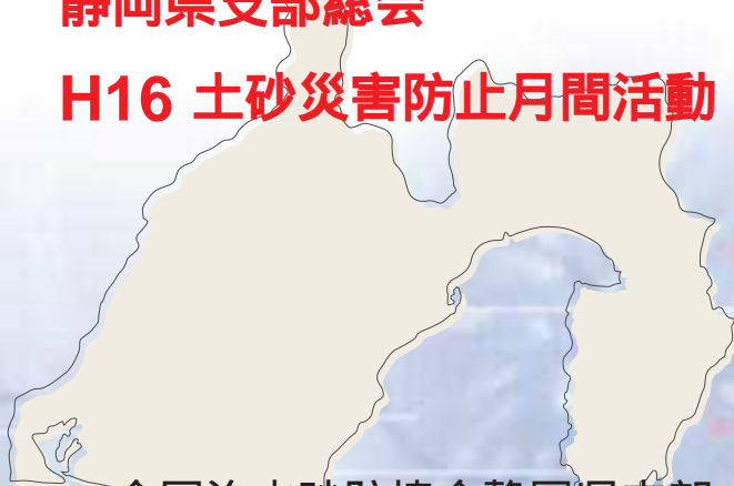
全国治水砂防協会静岡県支部