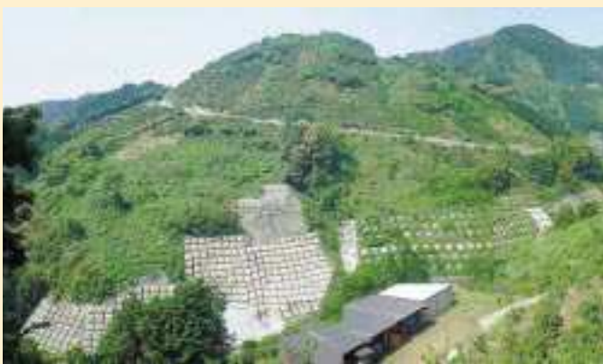
かみおおさわ 上大沢

事業名 / 災害関連緊急地すべり対策事業 地すべり対策事業 箇所 / 藤枝市上大沢地内 期間 / 平成11年（災害関連緊急地すべり対策事業） 平成13～15年（地すべり対策事業） 事業費 / 1,089百万円（災害関連緊急地すべり対策事業） 108百万円（地すべり対策事業） 概要 / 横ボーリング工 L = 6,050m アンカー工 N = 1,048本 事業効果 / 地すべりによる災害を防ぐため、対策工事を施工し、 人家40戸及び市道花倉上大沢線の安全が図られた。