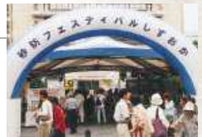
砂防フェスティバルの様子

当日は、台風6号の接近と梅雨前線の関係で時折強い雨がりましたが、約1,000名にのぼる来場者がありました。