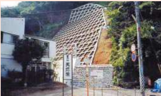
おおいわしばか 大岩芝欠No.3

事業名 / 急傾斜地崩壊対策事業 箇所 / 賀茂郡松崎町岩地地内 期間 / 平成11年～15年 事業費 / 315百万円 概要 / もたれ擁壁工 L = 39.3m 重力式擁壁工 L = 24.3m 張コンクリート工 L = 80.1m 吹付法砕工 A = 1,573㎡ 事業効果 / かけ崩れによる災害を防ぐため、対策工事を施工し、 人家36戸及び公民館の安全を図るとともに、松崎町 との連携により災害時の避難場所、夏季の観光駐車場 を確保する特定利用斜面事業を実施した。