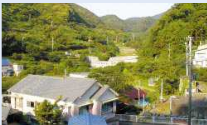
おおたがわ 太田川砂防えん堤

事業名 / 通常砂防事業 箇所 / 小笠郡菊川町倉沢地先 期間 / 平成11～15年 事業費 / 303百万円 概要 / 鋼製砂防えん堤 H = 12.0m、L = 52.0m 事業効果 / 土石流による災害を防ぐため、砂防えん堤を施工し、人家6戸及びJR東海道線の安全が図られた。