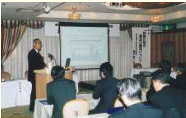
亀江砂防計画課長による講演