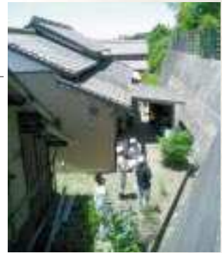
パトロールの様子

急傾斜地パトロールにより施設の破損や小規模の崩壊が確認された箇所については、今後早急に改善措置をとって参ります。