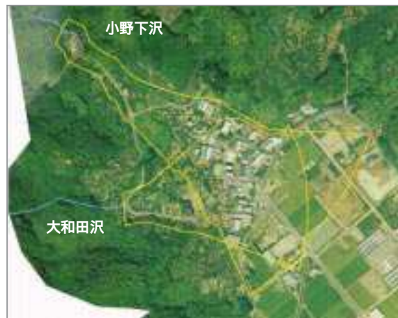
土砂災害警戒区域の指定(H16.5)

県内には土砂災害危険箇所は15,000箇所以上も存在します。県では、順次、土砂災害防止法の区域指定を進め、皆さんに土砂災害のおそれのある区域を明らかにし、市町村の警戒避難体制整備への支援等を進めていきます。