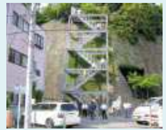
避難路「多比上道」の視察