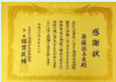
感謝状写真 5月20日に、斉藤前支部長に贈呈された感謝状 長い間ほんとうにご苦労様でした。