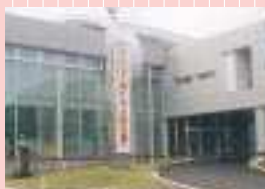
懸垂幕（河津町役場）