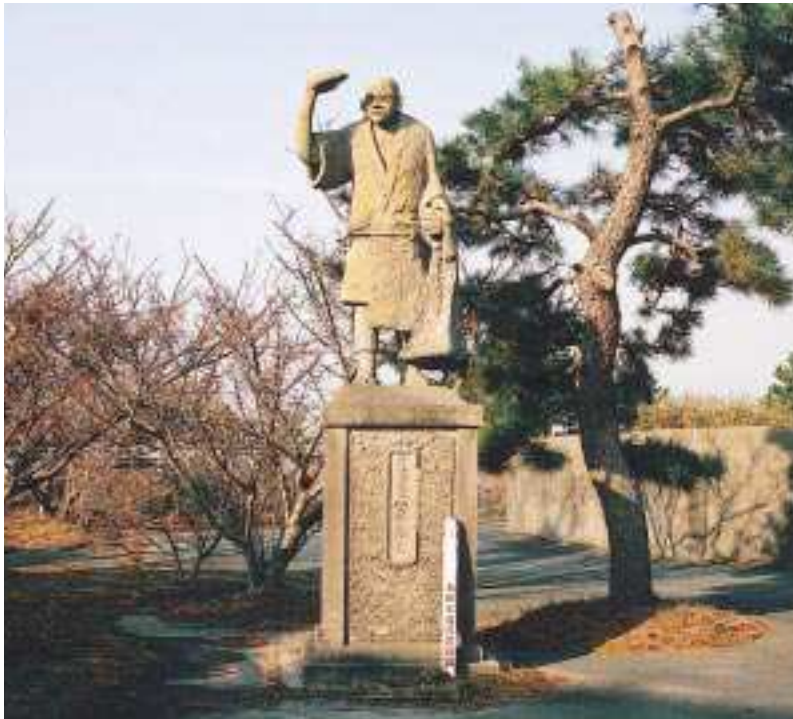
この像は太田川河口前川橋のたもとにあり、東西に広がる松並木の見事な砂防堤と、広々とした美しい畑地をみつめるように右手をかざした、高さ4.5mの像です。