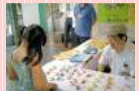
マスコット（砂防フェスティバルにて）