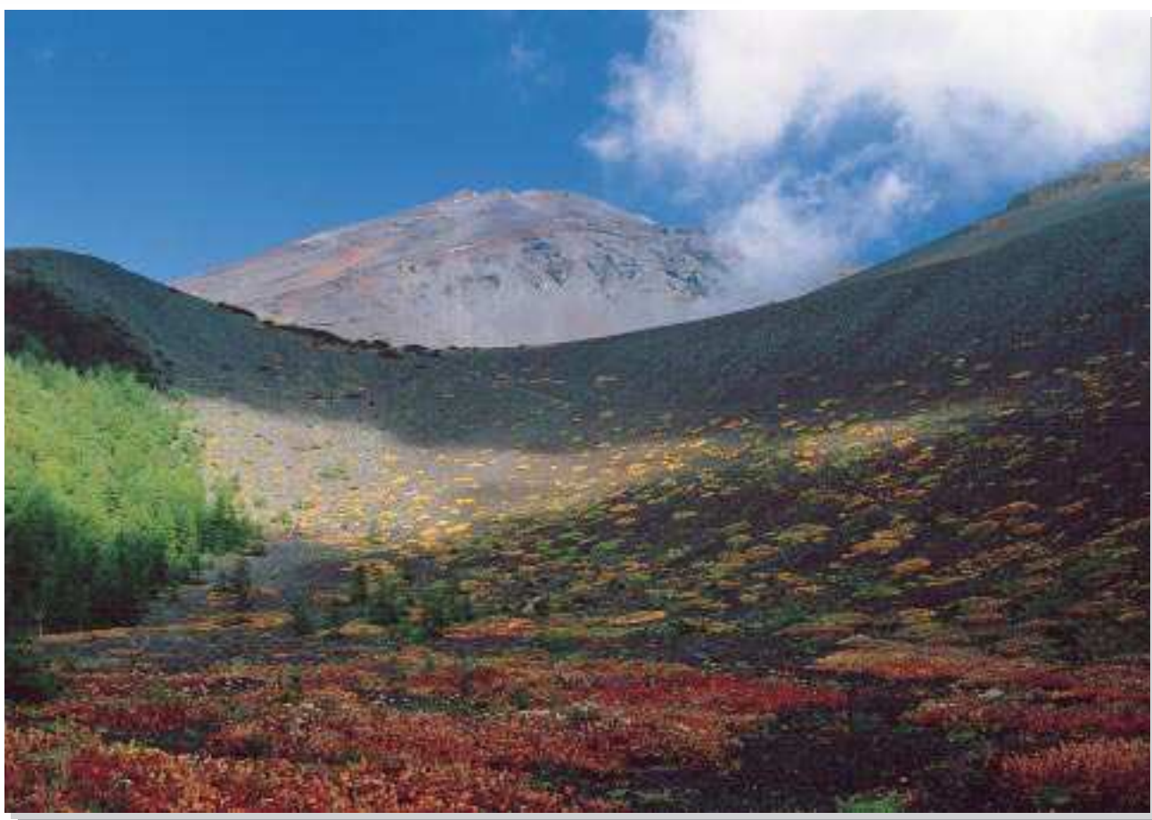
一瞬の晴れ間に（御殿庭）