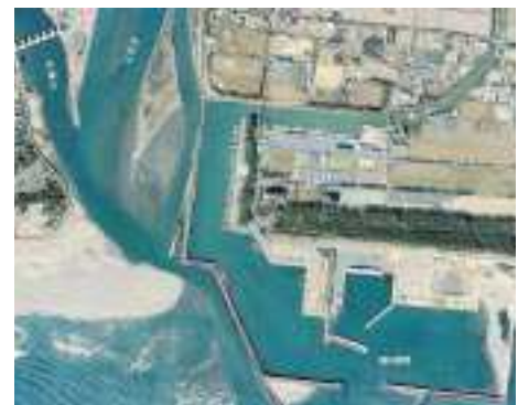
現在の福田漁港周辺

東名磐田I.C.と袋井I.C.より車で30分 磐田駅より車で約15分、 遠州鉄道バスで磐田駅より約30分 福田町営のエコバス豊浜南部線で役場 から約10分