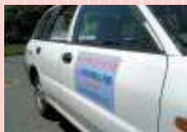
マグネットシート（急傾斜地パトロール中）