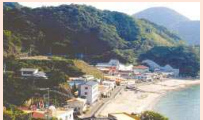
いわちにした 岩地西の田

事業名 / 急傾斜地崩壊対策事業 箇所 / 賀茂郡松崎町岩地地内 期間 / 平成11年～15年 事業費 / 315百万円 概要 / もたれ擁壁工 L = 39.3m 重力式擁壁工 L = 24.3m 張コンクリート工 L = 80.1m 吹付法砕工 A = 1,573㎡ 事業効果 / かけ崩れによる災害を防ぐため、対策工事を施工し、 人家36戸及び公民館の安全を図るとともに、松崎町 との連携により災害時の避難場所、夏季の観光駐車場 を確保する特定利用斜面事業を実施した。