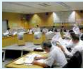
県庁総合司令室にて静岡県の地震防災対策の説明

1日目は、静岡県のこれまでの取組状況の説明と県地震防災センターの見学、2日目は、砂防・河川・港湾等の津波対策施設の視察を行いました。砂防関係施設としては、急傾斜地崩壊対策事業における津波避難地(「多比舟越第2」沼津市)・避難路(「多比上道」沼津市)の施工現場を視察し、各施設に対しての参加者の皆さんの関心は非常に高く、熱心に見学されていました。