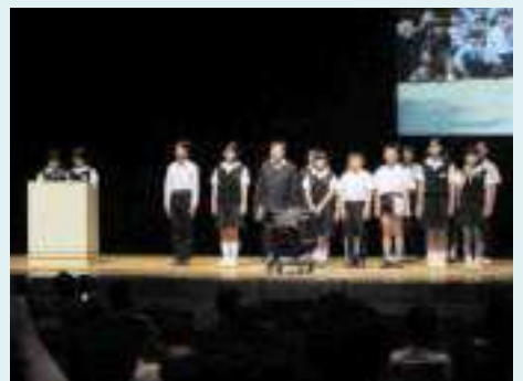
地元の双海町立下灘小学校の皆さんによる発表

翌日3日には、現地研修会が行なわれ水と緑の砂防モデル事業により実施された、『白猪谷堰堤』等の視察が行なわれました。