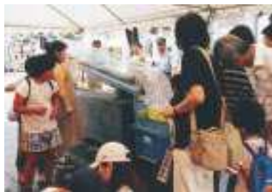
実験装置を興味深く見学する皆さん

このイベントは、国土交通省静岡河川事務所、沼津河川国道事務所、富士砂防事務所、静岡県、静岡市が主催し、土砂災害防止に関するパネルや模型の展示、砂防について学習するクイズラリーのほか、SBSラジオの公開生放送も行われました。