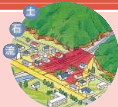
土石流に対する区域指定の例