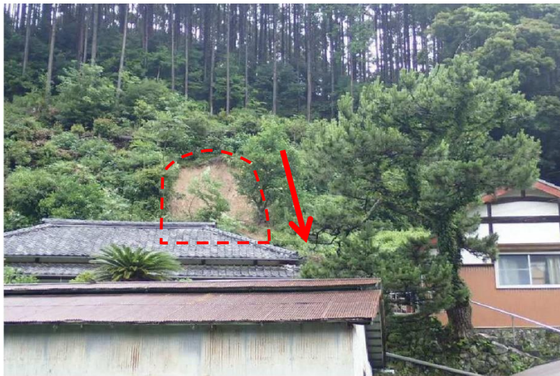
がけ崩れ発生直後 (R2.7.8)