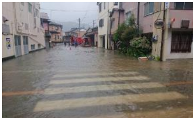
後藤沢(家山地先) 排水作業