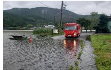
野守の池(家山地先) 巡視