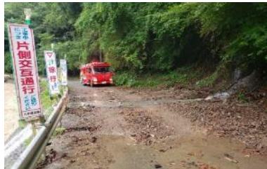
家山川(塩本地先) 道路、河川巡視