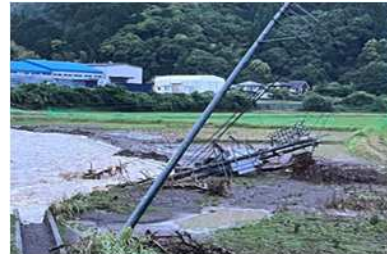
天方地区三倉川 現場確認