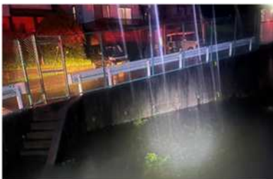
飯田地区 現場確認