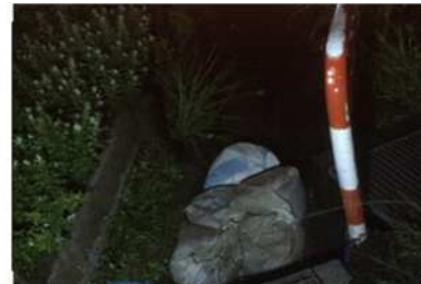
飯田地区 土のう積み