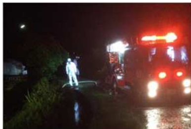
飯田地区 排水作業