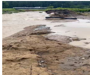
決壊した敷地川堤防