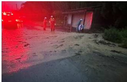
山側からの土砂流出による交通誘導