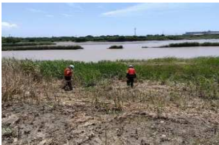
行方不明者搜索活動