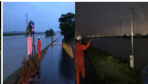
太田川巡視・避難広報活動