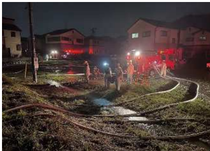
広幡地区（潮）の浸水状況 排水作業