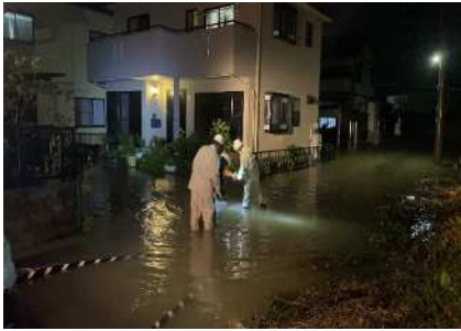
広幡地区（潮）の浸水状況 排水作業