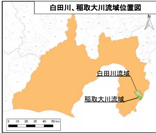
白田川、稲取大川流域位置図