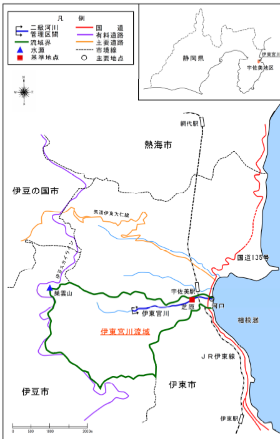
(参考図) 伊東宮川水系図