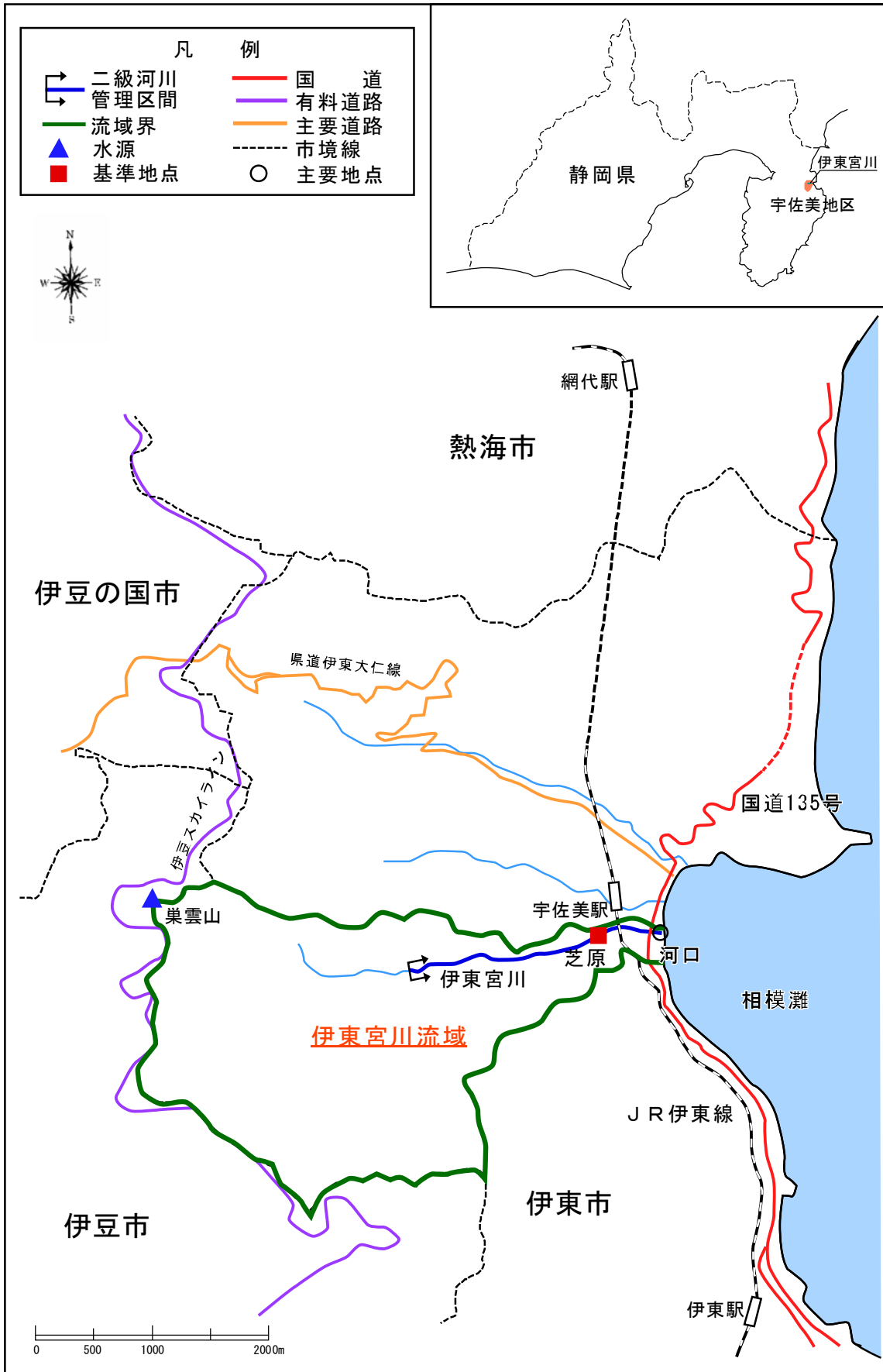
(参考図) 伊東宮川水系図