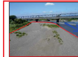
河道掘削(イメージ)