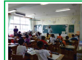
出前講座(小学校) イメージ