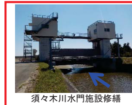
須々木川水門施設修繕