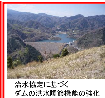
治水協定に基づくダムの洪水調節機能の強化