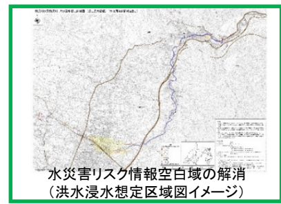
水災害リスク情報空白域の解消 (洪水浸水想定区域図イメージ)