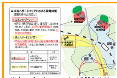
災害ハザードエリアにおける開発抑制