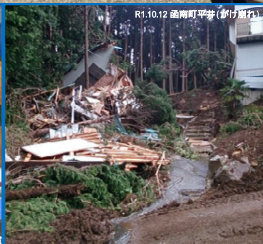
R1.10.12 函南町平井(がけ崩れ)