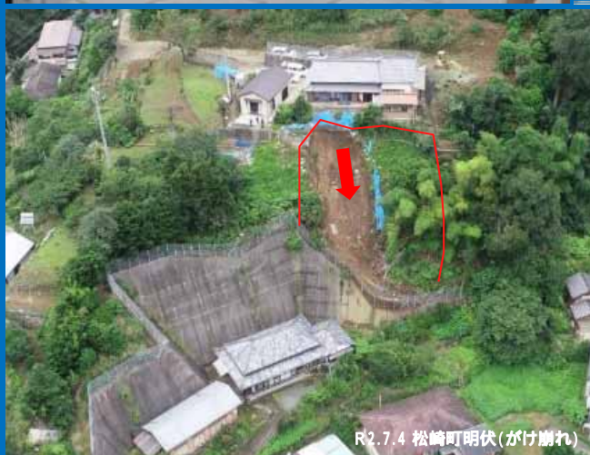
R2.7.4 松崎町明伏(がけ崩れ)