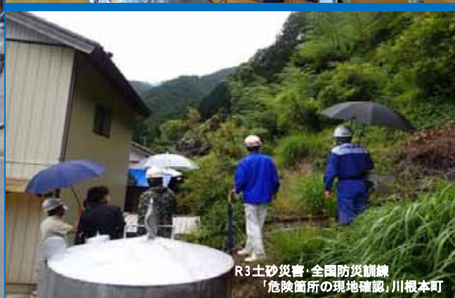
R3 土砂災害・全国防災訓練 「危険箇所の現地確認」川根本町