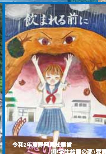
令和2年度静岡県知事賞 (中学生絵画の部)受賞