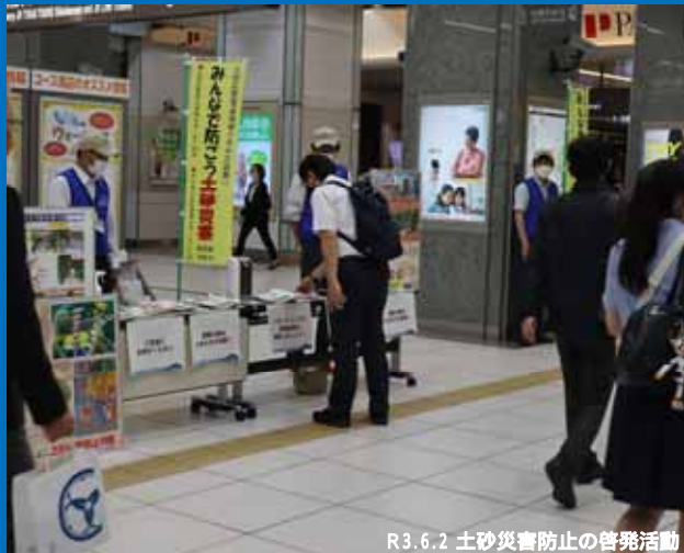
R3.6.2 土砂災害防止の啓発活動

梅雨時で土砂災害が発生しやすくなる6月は「土砂災害防止月間」です。 「日頃の備え」と「早めの避難」を心掛けて、突然の災害から命を守りましょう！