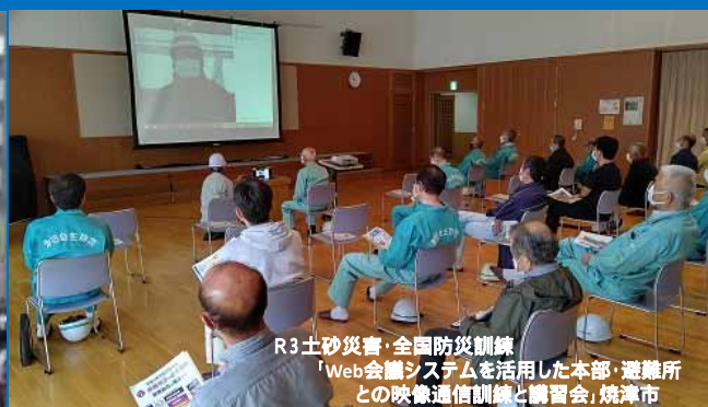
R3 土砂災害・全国防災訓練 「Web会議システムを活用した本部・避難所 との映像通信訓練と講習会」焼津市