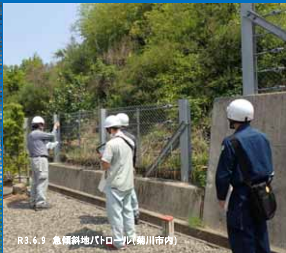
R3.6.9 急傾斜地パトロール(蒲川市内)