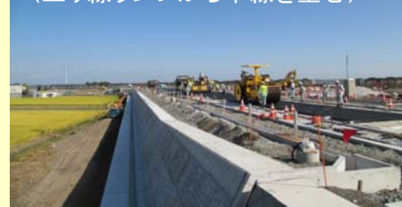
工事実施状況 (上り線ランプから本線を望む)

焼津市では、「大井川焼津藤枝スマートIC」の供用開始に向けて、ランプ築造及び周辺道路整備工事を実施しています。今後は、ICへの円滑な誘導を図り、多くの皆様にご利用いただけるように周辺の主要幹線道路に案内標識を設置していきます。