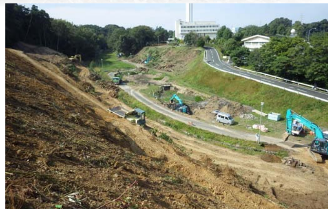
施工状況(下り線側ランプ)